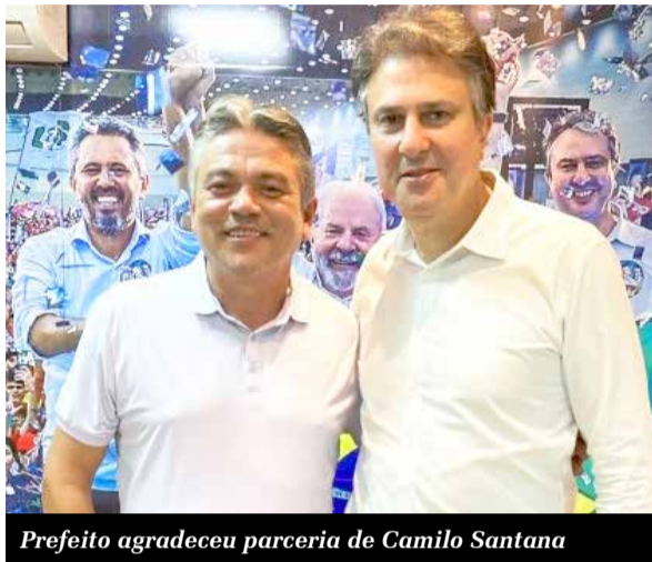
Prefeito agradeceu parceria de Camilo Santana

O prefeito do município do Barro, George Feitosa, destacou a parceria com o senador Camilo Santana, pela destinação de recursos voltados ao fortalecimento de áreas como infraestrutura, saúde e educação. Segundo o gestor municipal, os investimentos contribuem para o desenvolvimento da cidade e para a melhoria dos serviços oferecidos à população. Os recursos deverão auxiliar na realização de ações e projetos que beneficiem diretamente os moradores. A administração municipal ressaltou, ainda, que seguirá trabalhando para transformar os investimentos em obras e oportunidades.