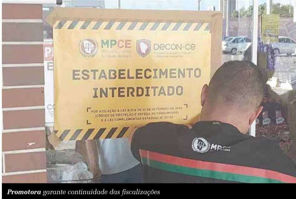
Promotora garante continuidade das fiscalizações

Robson Roque redacao@jornaldocariri.com.br