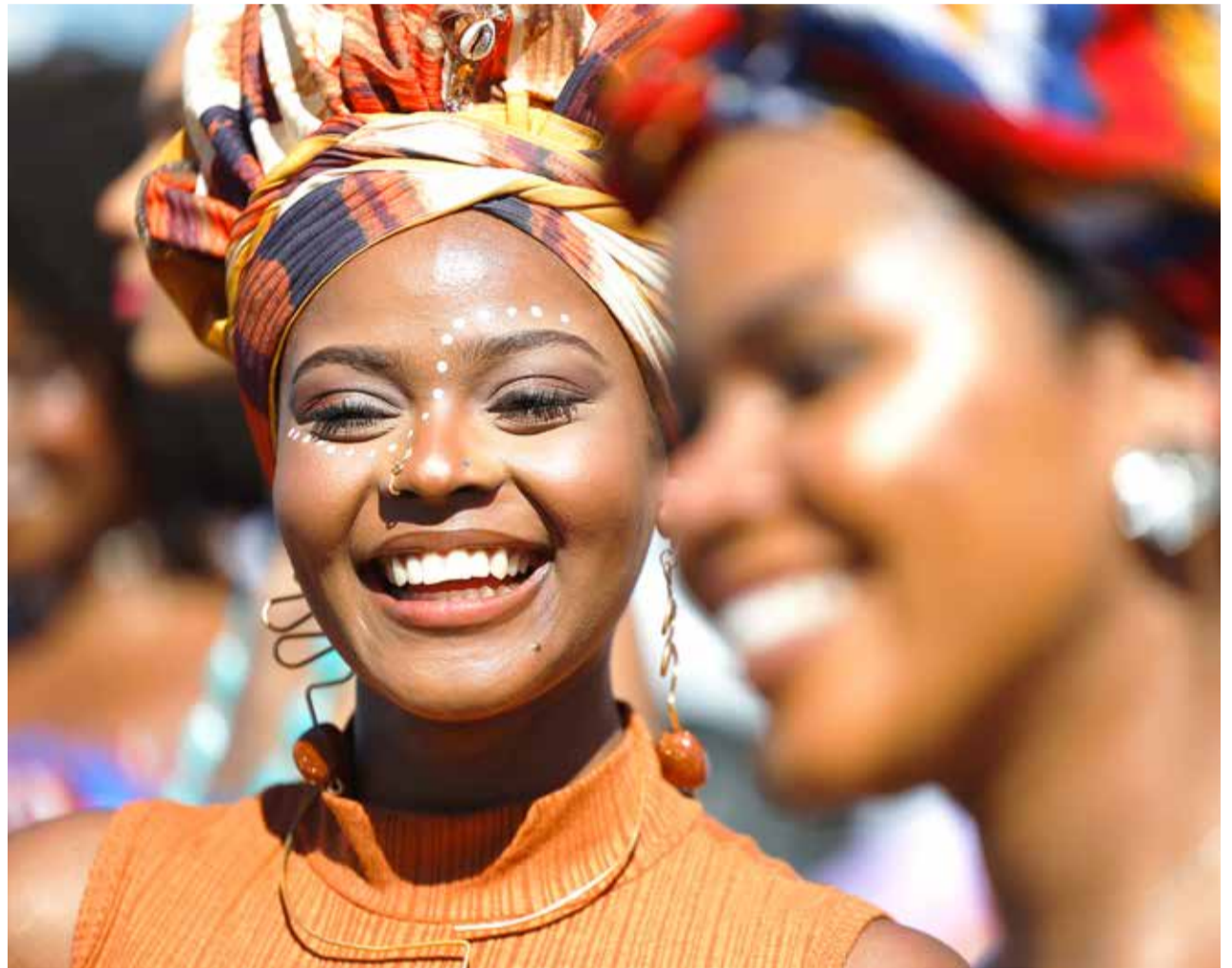
Centro nasce para estabelecer referência em equidade racial

“O Cariri apresenta um contexto territorial,