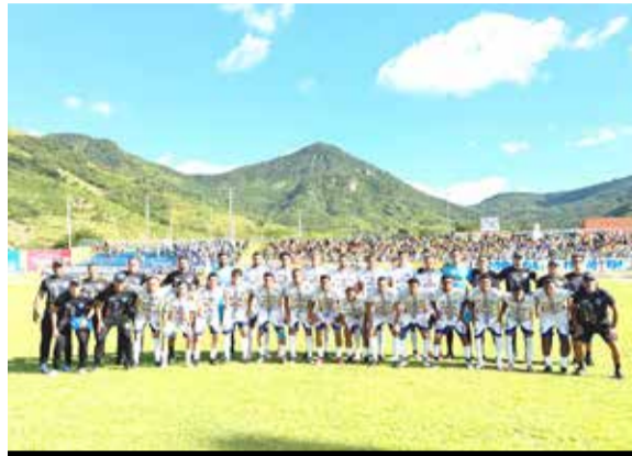
Crato é derrotado pelo Itapipoca e fica na Série B em 2027

O acesso do Crato bateu na trave pelo segundo ano consecutivo. Se em 2025 o algoz foi o Quixadá, em 2026 o Itapipoca barrou o acesso. Em ambos os cenários, o clube tropeçou em falhas próprias: do pênalti perdido por Rogerinho, no ano passado, ao empate cedido em casa após a virada - erros de arbitragem ocorreram, mas não anulam as falhas do próprio time. Resta a expectativa de que em 2027 não se repitam os vacilos rumo à Série A.