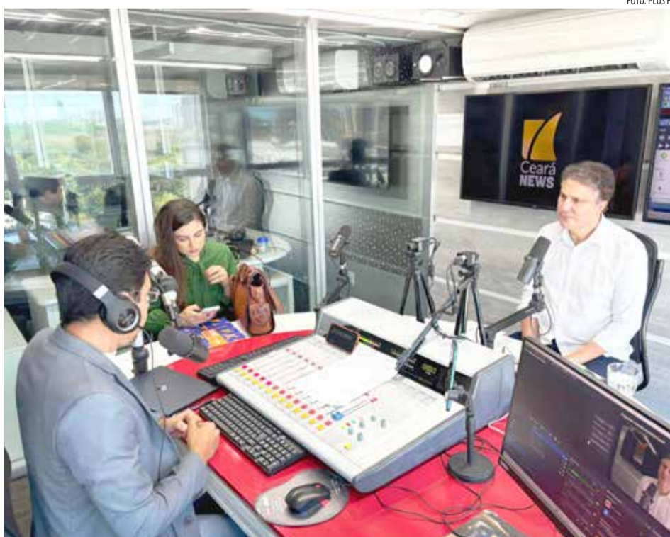
Senador Camilo Santana, no estúdio da Plus FM, em Fortaleza

Em entrevista ao Jornal do Cariri/Plus FM/Portal CN7, Camilo afirmou que o Estado colhe resultados de uma política que teve início na gestão de Cid Gomes (PSB), passou por seus dois mandatos e segue atualmente sob o comando de Elmano. “É um projeto que