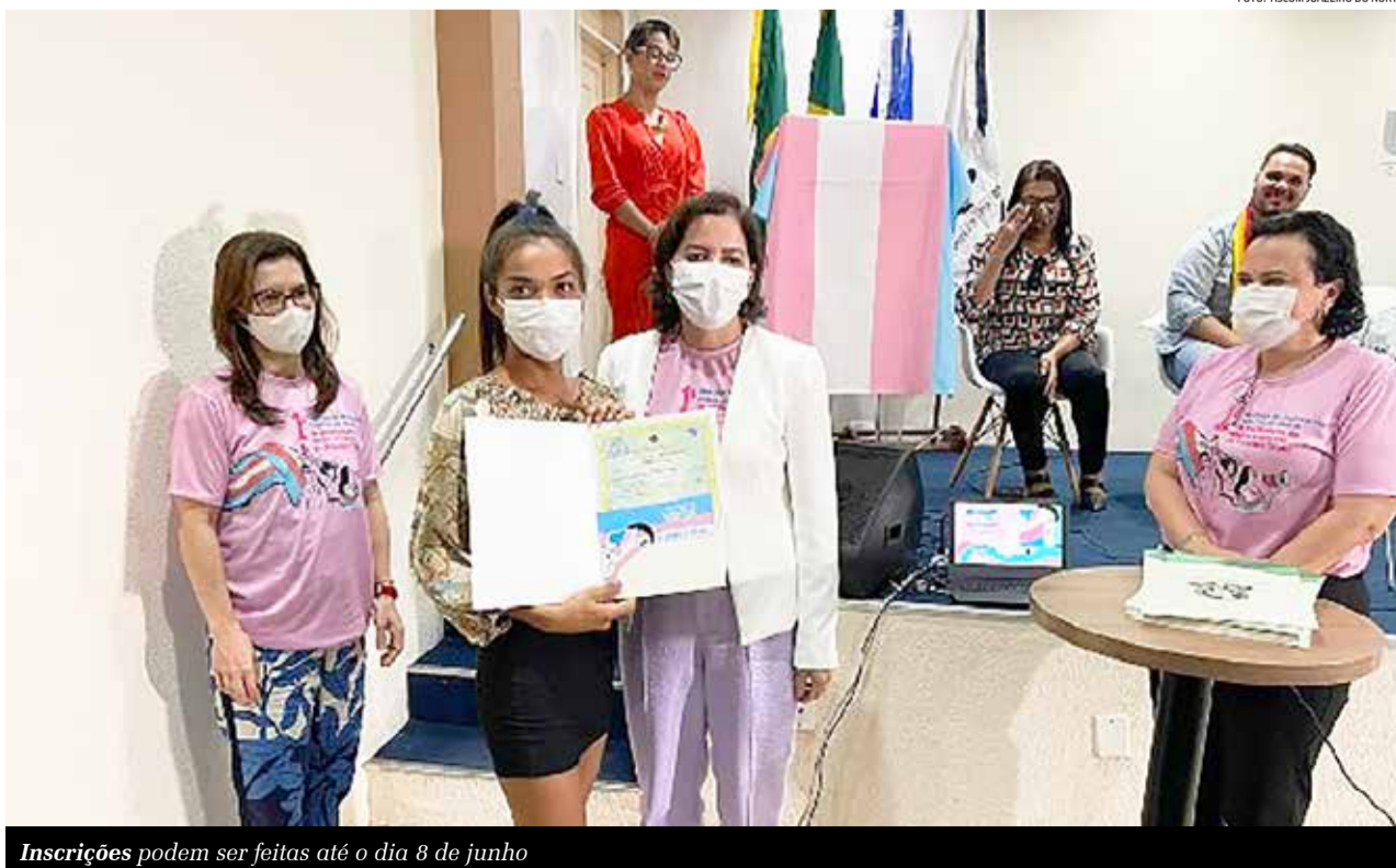
Inscrições podem ser feitas até o dia 8 de junho