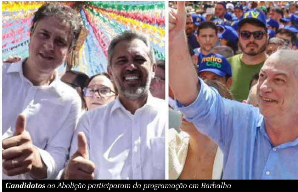
Candidatos ao Abolição participaram da programação em Barbalha