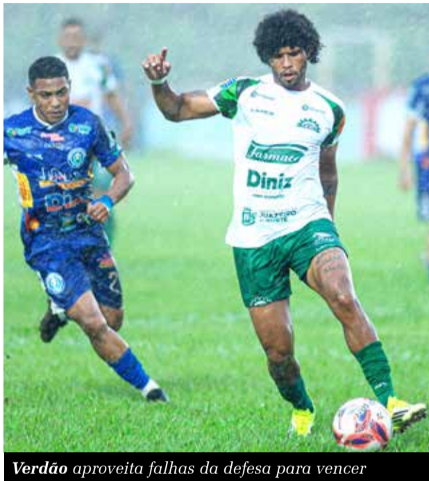
Verdão aproveita falhas da defesa para vencer

meiro turno, o Icasa goleou por 5 a 1. Se vencer novamente, chega aos 16 pontos e ultrapassa o Crato, atual líder com 15.