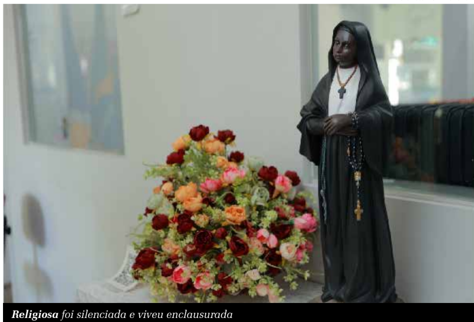
Religiosa foi silenciada e viveu enclausurada