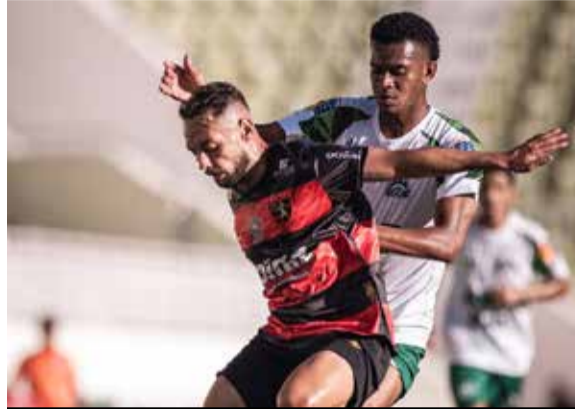
Guarani de Juazeiro e Icasa voltam a se enfrentar pela Série B