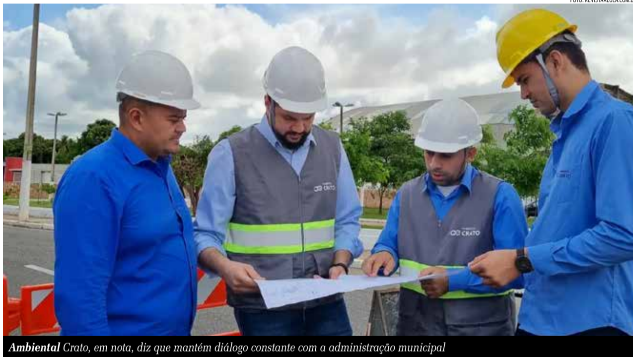
Ambiental Crato, em nota, diz que mantém diálogo constante com a administração municipal