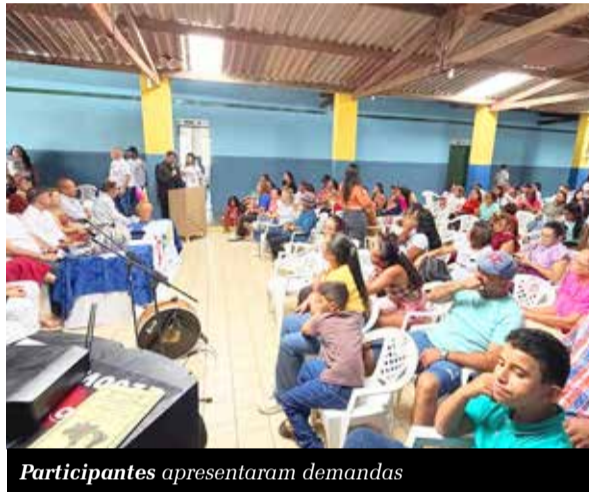
Participantes apresentaram demandas

O município de Campos Sales sediou o encontro "Vozes que Constroem". A iniciativa, promovida pelo Partido dos Trabalhadores (PT) e pelo Partido Social Democrático (PSD), teve como foco o fortalecimento do protagonismo feminino e a construção de políticas públicas voltadas às mulheres. Durante a programação, participantes apresentaram demandas e relataram desafios enfrentados no cotidiano, destacando a necessidade de ações concretas do poder público. Entre as principais reivindicações estão a instalação da Casa da Mulher no município.