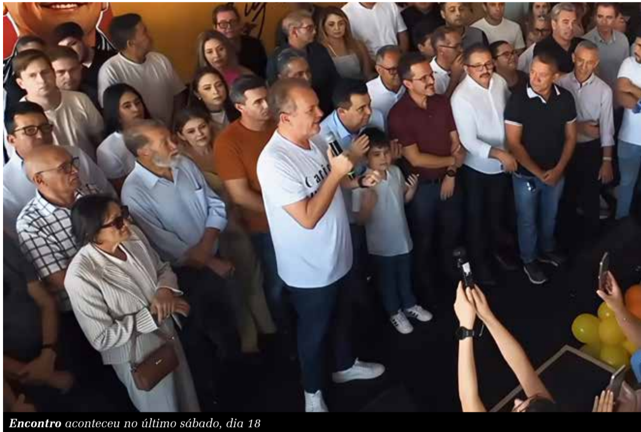
Encontro aconteceu no último sábado, dia 18

André Figueiredo lembrou que a sigla se tornou o maior partido do Ceará com a entrada do senador Cid Gomes e, com a sua saída, todos os seus aliados o seguiram. “Pra gente é uma ação legítima”, disse André, ao avaliar que o partido sempre foi mediano. “Não é a ausência de