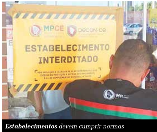
Estabelecimentos devem cumprir normas

Os municípios de Juazeiro do Norte, Crato, Barbalha, Missão Velha e Aurora receberam ações de fiscalizações do Programa Estadual de Proteção e Defesa do Consumidor (Decon). As ações fazem parte de um trabalho contínuo de monitoramento do mercado, abrangendo diferentes segmentos do comércio. Durante as inspeções, foram constatados problemas na formação de preços, especialmente no setor de combustíveis, além de irregularidades sanitárias em estabelecimentos que comercializam alimentos. Entre as principais ocorrências estão falhas na conservação de produtos e a venda de itens fora do prazo de validade.