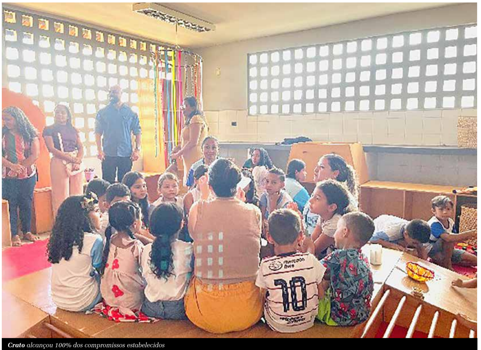
Crato alcançou 100% dos compromissos estabelecidos

D esde que o Pacto Cearense pela Primeira Infância foi implantado, há um ano, instituições públicas, privadas e organizações da sociedade civil atuam coletivamente em prol de fortalecer as políticas públicas voltadas às crianças de zero a seis anos de idade. Em novembro de 2025, todos os municípios do Cariri aderiram o Pacto que, a nível estadual, já tem 36% dos compromissos firmados pelas prefeituras concluídos, enquanto os órgãos estaduais atingiram 48,9% de execução das ações pactuadas.