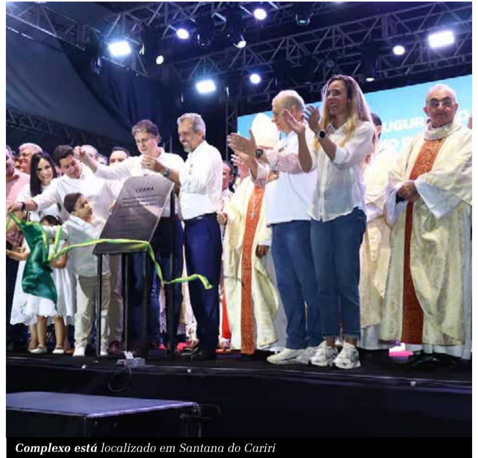
Complexo está localizado em Santana do Cariri