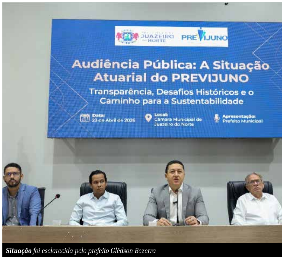
Situação foi esclarecida pelo prefeito Glêdson Bezerra

Diante desse cenário, a conclusão apresentada pela gestão é de que, apesar dos avanços e do bom desempenho atual, o sistema previdenciário municipal necessita de medidas estruturais para garantir sua sustentabilidade no futuro. Entre as alternativas discutidas está o ajuste na alíquota de contribuição. Nesse contexto, o prefeito enviou à Câmara um projeto de lei que revoga a legislação aprovada em 2024 e propõe a fixação de uma alíquota mínima de 14% para servidores ativos, aposentados e pensionistas.