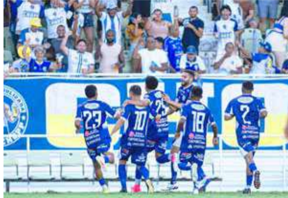
Crato empatou com o Guarani e abriu dois pontos sobre o Icasa