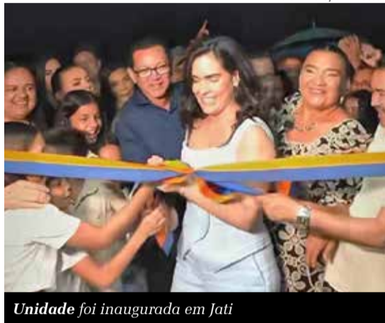
Unidade foi inaugurada em Jati

A população de Jati passou a contar com um novo equipamento de ensino com a inauguração da Escola em Tempo Integral Vereador Cícero Gomes. A unidade foi construída com estrutura moderna e totalmente equipada, voltada para atender estudantes em jornada ampliada. O modelo de ensino integral busca oferecer mais tempo de permanência na escola, com atividades pedagógicas, culturais e de reforço educacional. De acordo com a gestão municipal, o objetivo é garantir mais qualidade no ensino e ampliar as oportunidades de aprendizagem para os alunos da rede pública.