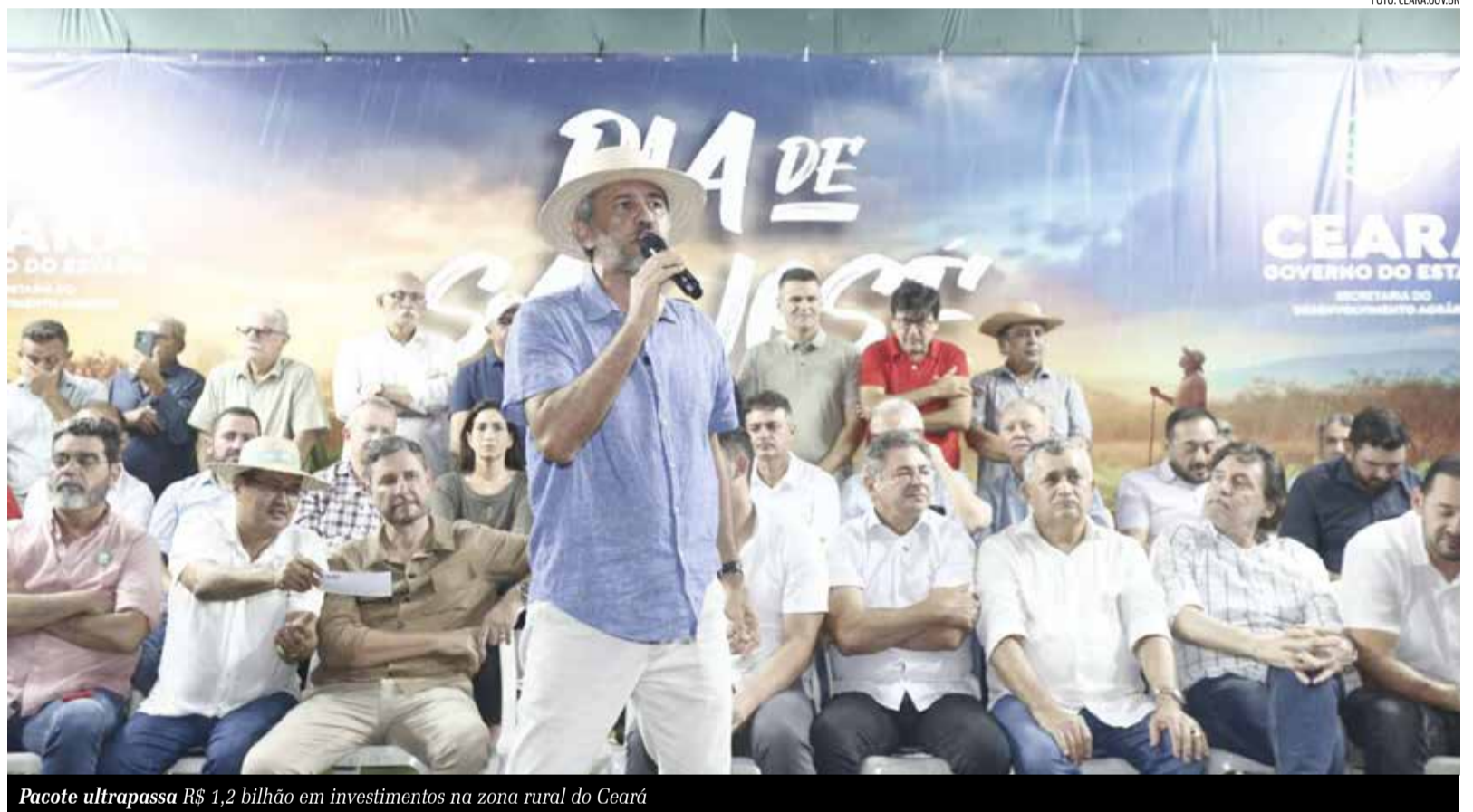
Pacote ultrapassa R$ 1,2 bilhão em investimentos na zona rural do Ceará