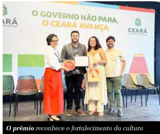
O prêmio reconhece o fortalecimento da cultura

A Secretaria Municipal de Cultura e Turismo de Aurora foi reconhecida pela Secretaria da Cultura do Estado do Ceará (Secult-CE), em parceria com o Centro Cultural do Cariri, por promover o fortalecimento de políticas culturais e à integração entre os municípios da região do Cariri, por meio do Projeto Gira Cariri 2025. Dos 29 municípios que integram o projeto, 17 foram contemplados com o reconhecimento.