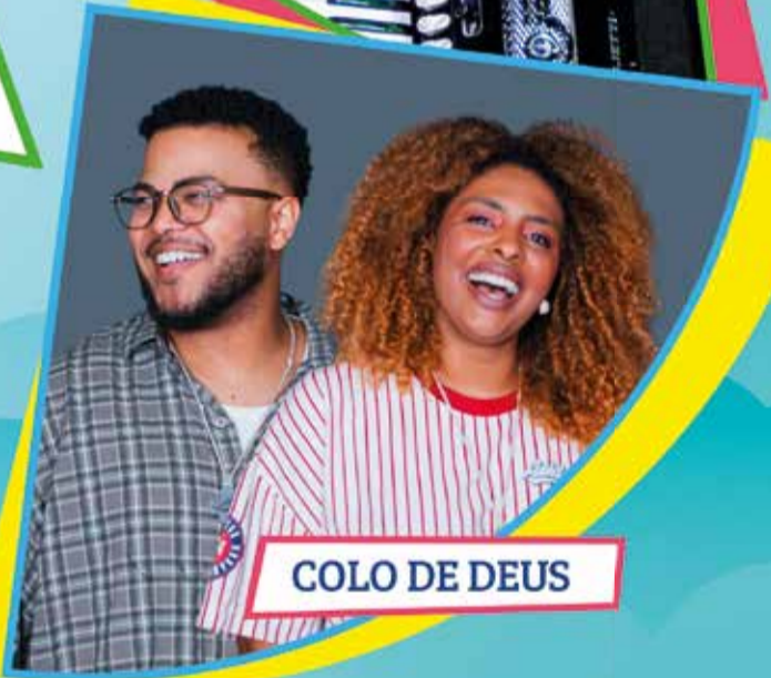
COLO DE DEUS