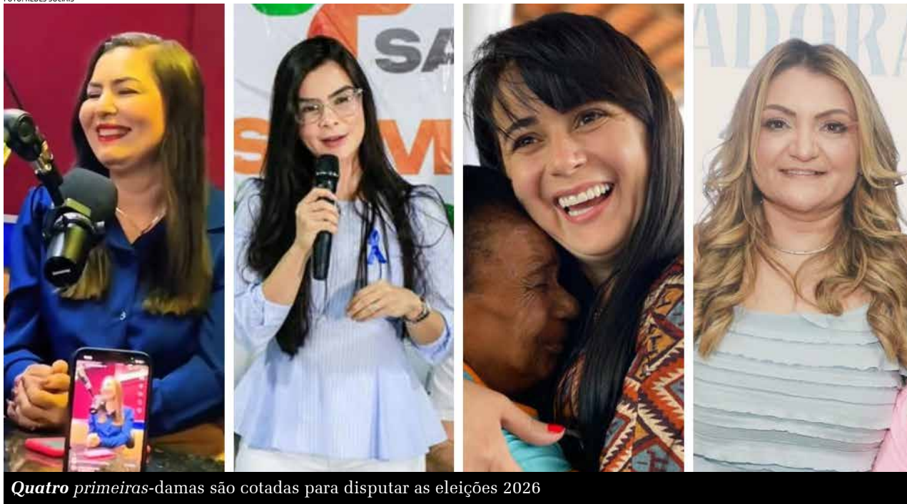
Quatro primeiras-damas são cotadas para disputar as eleições 2026