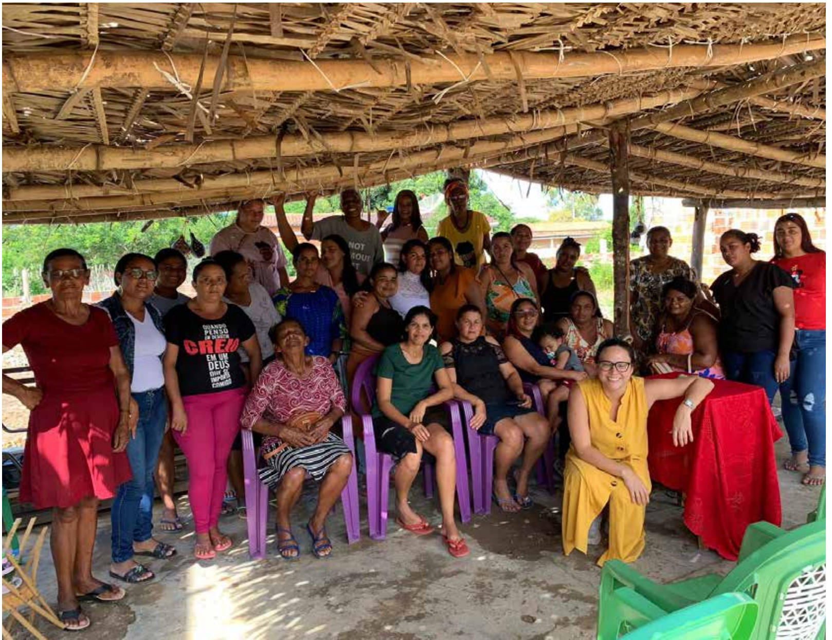
Moradores sofreram intimidação e tentativas de restrição de circulação no território

Segundo relatos da comunidade, moradores passaram a sofrer ameaças de morte, intimidações e tentativas de restrição da circulação no território, pouco mais de um mês após a titulação definitiva das terras, em 19 de novembro de 2025. Há registros de declarações de que qualquer pessoa que entrasse na área seria morta. “Isso evidencia a existência de grave conflito fundiário e de risco concreto