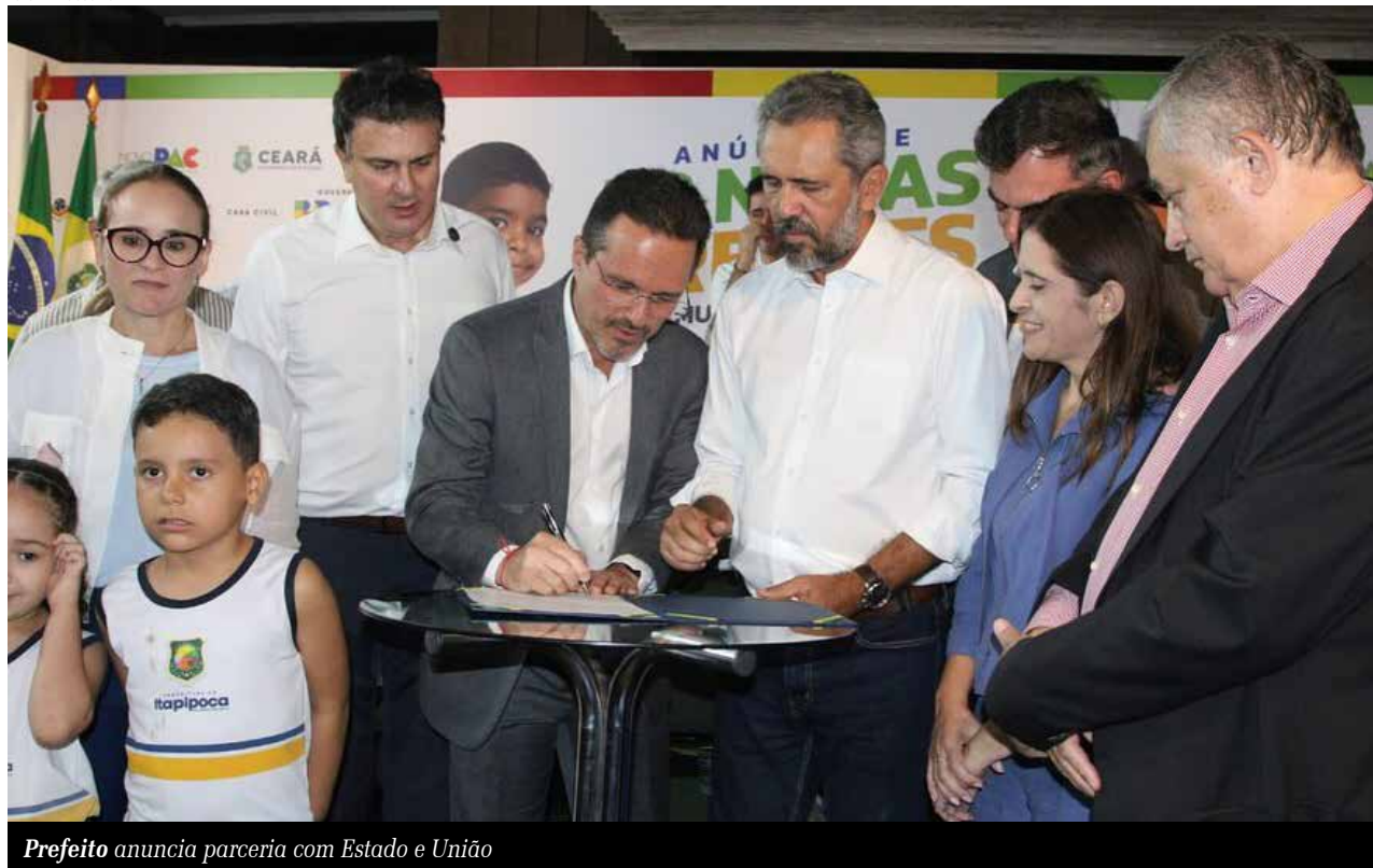
Prefeito anuncia parceria com Estado e União