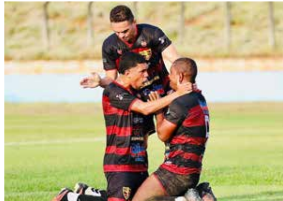
Guarani começou a definir seus alvos no mercado da bola