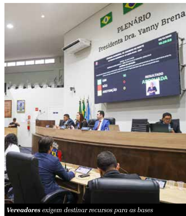
Vereadores exigem destinar recursos para as bases