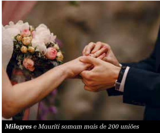
Milagres e Mauriti somam mais de 200 uniões

M ilagres foi a cidade do Cariri que mais registrou cerimônias de casamento em 2025. De acordo com dados do Operador Nacional do Registro Civil, atualizados em 12 de dezembro de 2025, o município se destacou como líder no número de matrimônios registrados no Cariri. Ao todo, foram contabilizadas 118 cerimônias, número que coloca Milagres no topo do ranking regional. O resultado evidencia um crescimento expressivo na celebração de casamentos na cidade, consolidando o município como referência nesse indicador social. Na sequência, está Mauriti, com 91 casamentos registrados, enquanto Barro ocupa a terceira posição, com 90 matrimônios ao longo do ano.