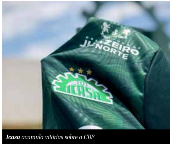
Icasa acumula vitórias sobre a CBF

O Icasa venceu mais uma etapa na longa disputa judicial contra a CBF. O STJ rejeitou os embargos da entidade, que buscava dividir a culpa com o clube, pelo erro que resultou no não acesso do Icasa à Série A de 2014. O placar foi 3 a 0 para o Verdão. A pergunta que persiste é quando o processo será, de fato, concluído. Enquanto isso, o Icasa, imerso em crise financeira, aguarda o desfecho para, enfim, respirar e planejar o futuro.