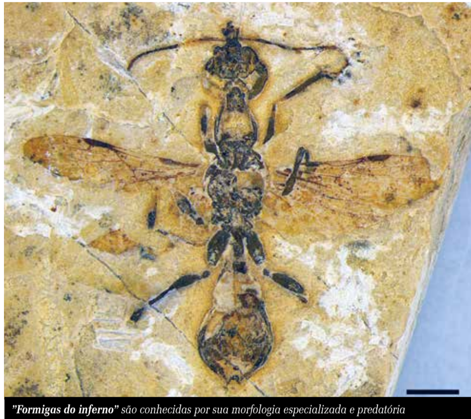
“Formigas do inferno” são conhecidas por sua morfologia especializada e predatória

Segundo o pesquisador, esta é a primeira ocorrência confirmada dessas formigas no hemisfério sul. A descoberta antecipa em mais de 13 milhões de anos o registro mais antigo