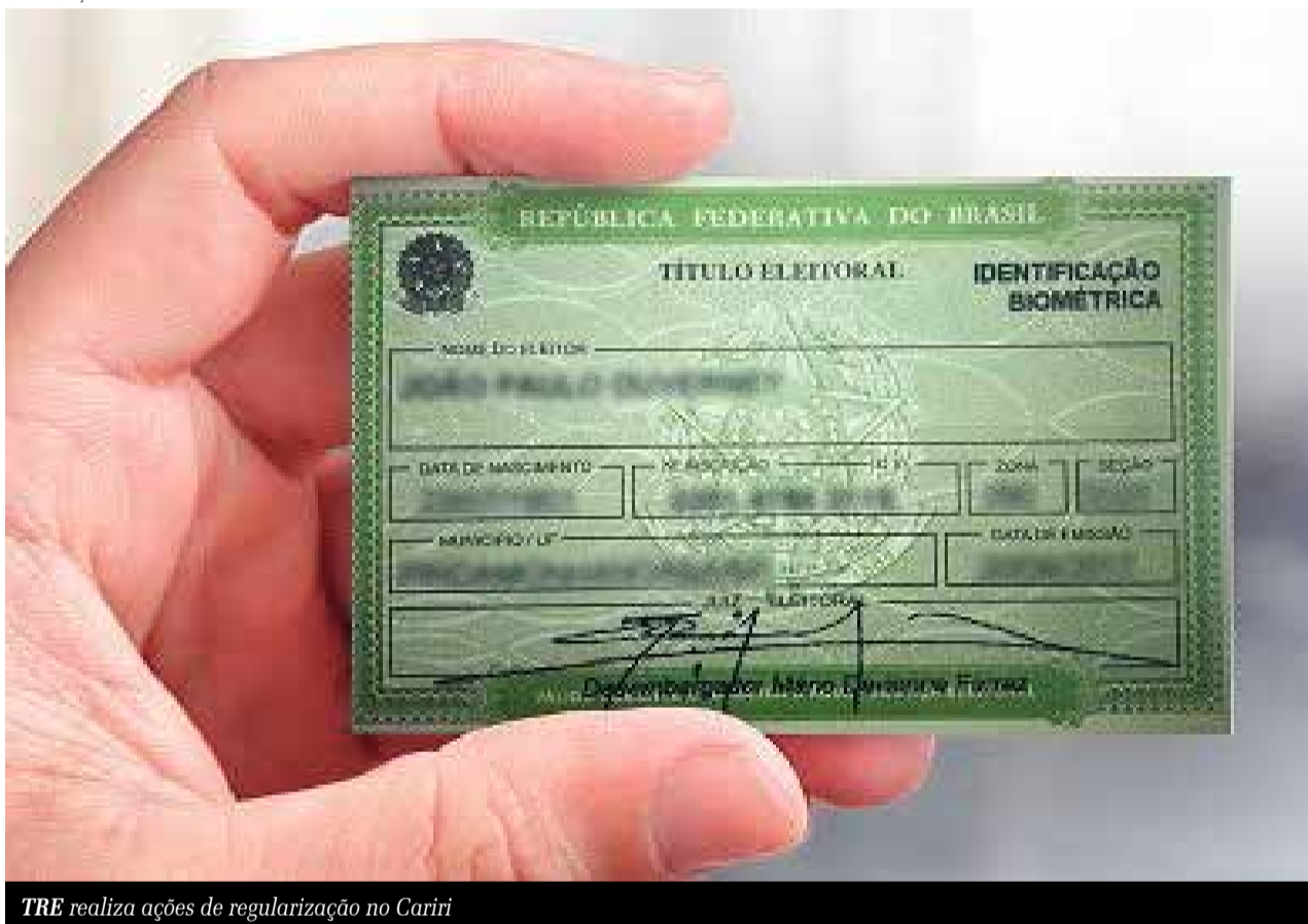
TRE realiza ações de regularização no Cariri