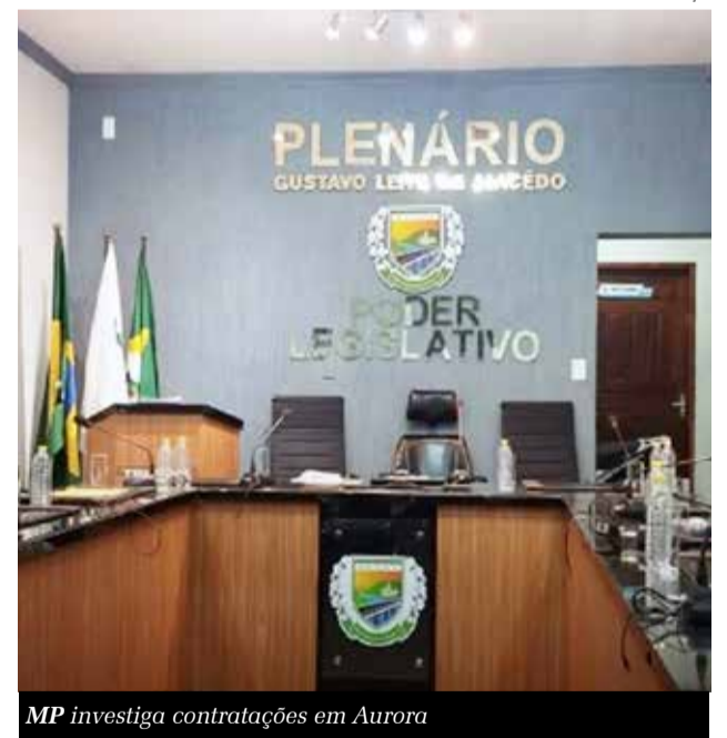
MP investiga contratações em Aurora

observância dos princípios constitucionais da publicidade na gestão pública. Em nota, a Câmara de Aurora afirmou que as contratações respeitaram os princípios constitucionais, mas disse que, em atenção à recomendação do MPCE, optou por anular os procedimentos de contratações diretas.