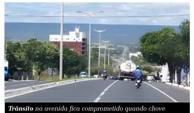
Trânsito na avenida fica comprometido quando chove