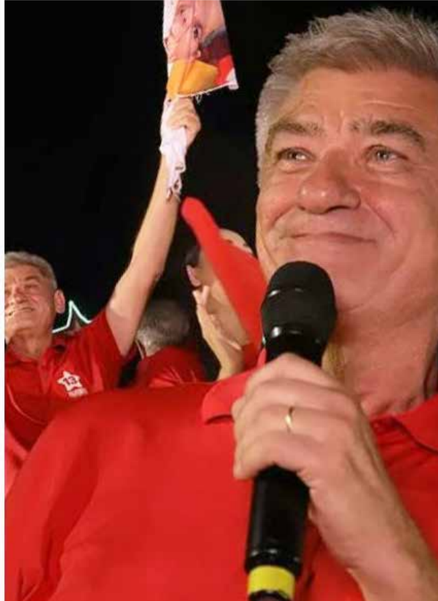
Jati e Jardim extrapolaram limites de gastos, e foram alertados pelo TCE