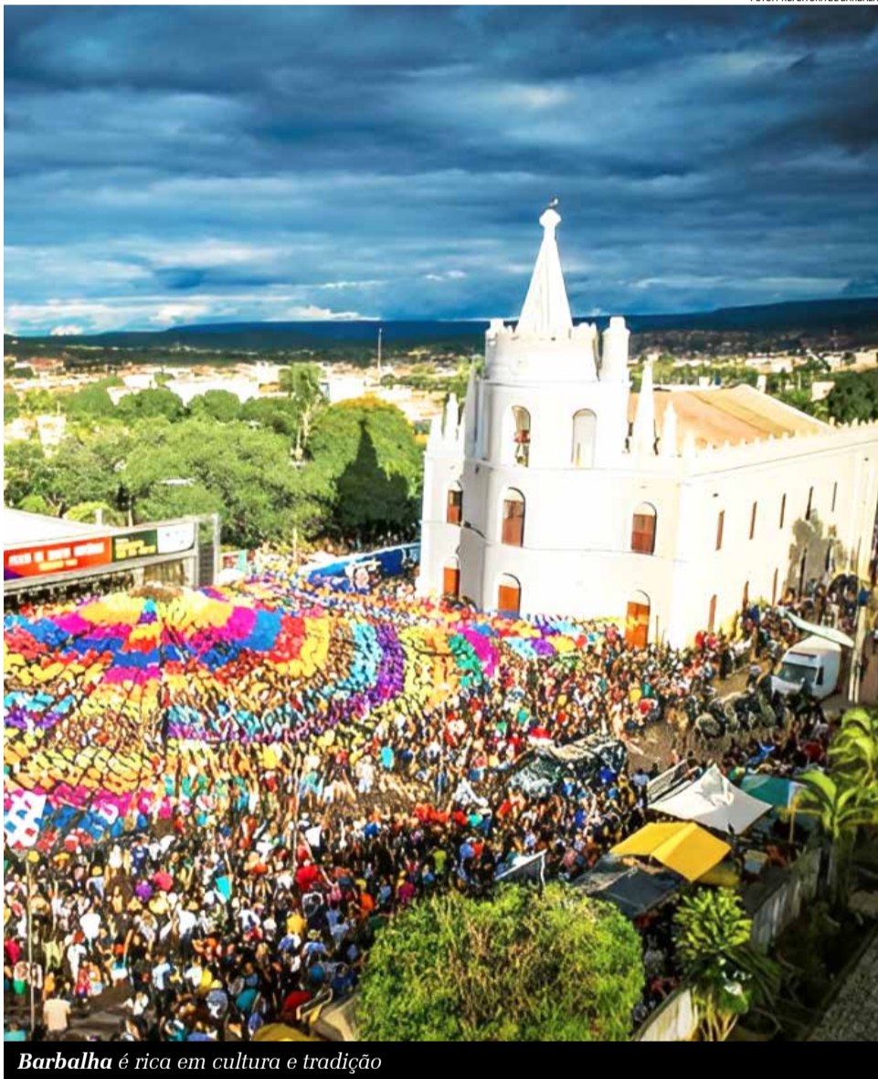
Barbalha é rica em cultura e tradição

A pós identificar que a gastronomia local, aliada ao patrimônio histórico e cultural, poderia se tornar um diferencial competitivo no cenário turístico, a Prefeitura de Barbalha criou projeto para criação do Polo Gastronômico do Centro Histórico de Barbalha. Dessa forma, o projeto foi estruturado a partir de um diagnóstico do potencial gastronômico da região, seguido por reuniões com empreendedores locais, representantes do setor e parceiros estratégicos, como o Sebrae e o Senac. A partir daí, houve a construção de um plano de ação participativo, que culminou com o lançamento oficial do projeto na última semana.