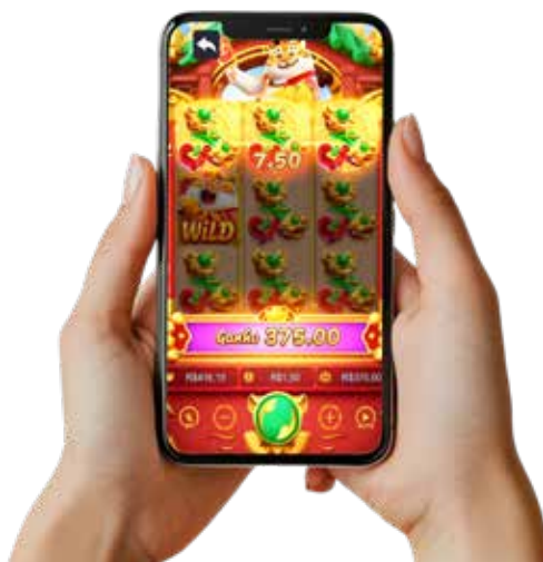
Influenciadores são presos por divulgar jogos de azar

Com base nas investigações que se iniciaram em abril de 2024, os influenciadores, que possuem milhares de seguidores, gravavam vídeos - com ganhos fictícios - em plataformas de cassi-