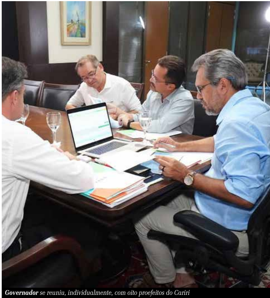
Governador se reuniu, individualmente, com oito prefeitos do Cariri

O governador do Ceará, Elmano de Freitas (PT), reuniu-se com prefeitos do Cariri, na semana passada, cumprindo uma promessa feita no início do ano. Em encontros individuais com gestores de oito municípios, o governador anunciou a conclusão de obras, construção de novos equipamentos, além de recursos para áreas como saúde, infraestrutura e mobilidade urbana.