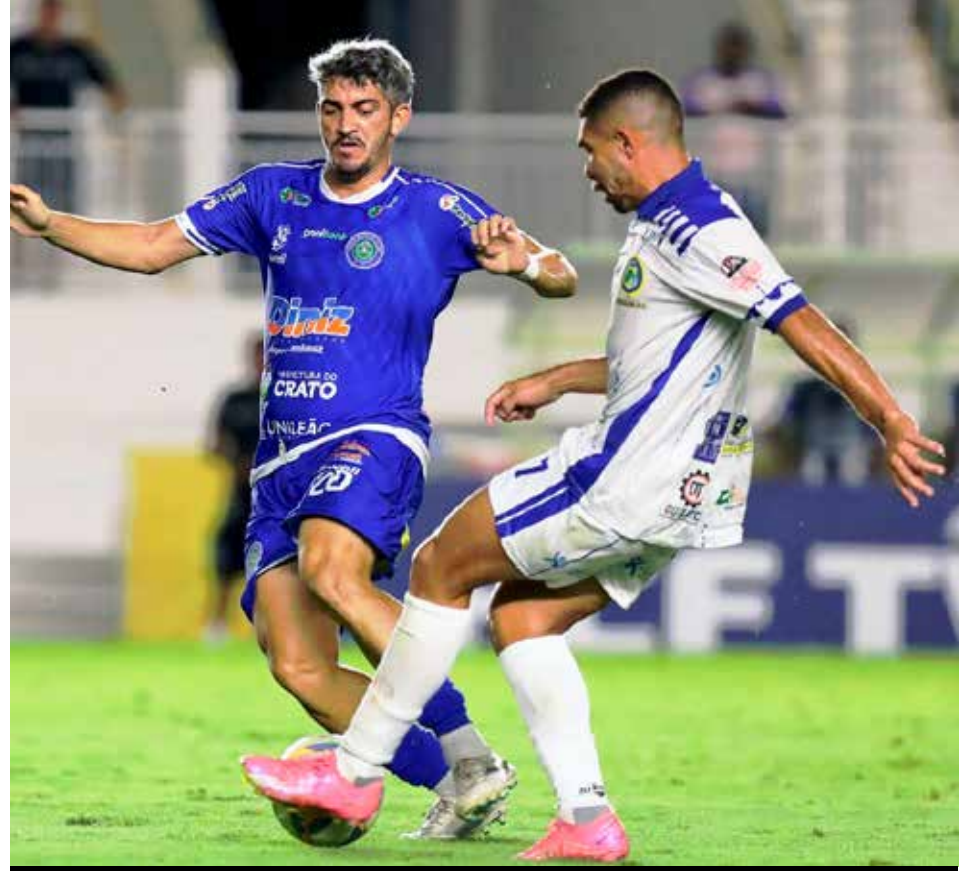
Acesso à Série A foi decidido nos pênaltis

Com o resultado, o Quixadá enfrentará o Maranguape para decidir o campeão da Segunda Cearense 2025. No próximo ano, o Cearense Série B contará com cinco equipes da região do Cariri: Icasa, Crato, Guarani, Cariri FC e Barbalha.