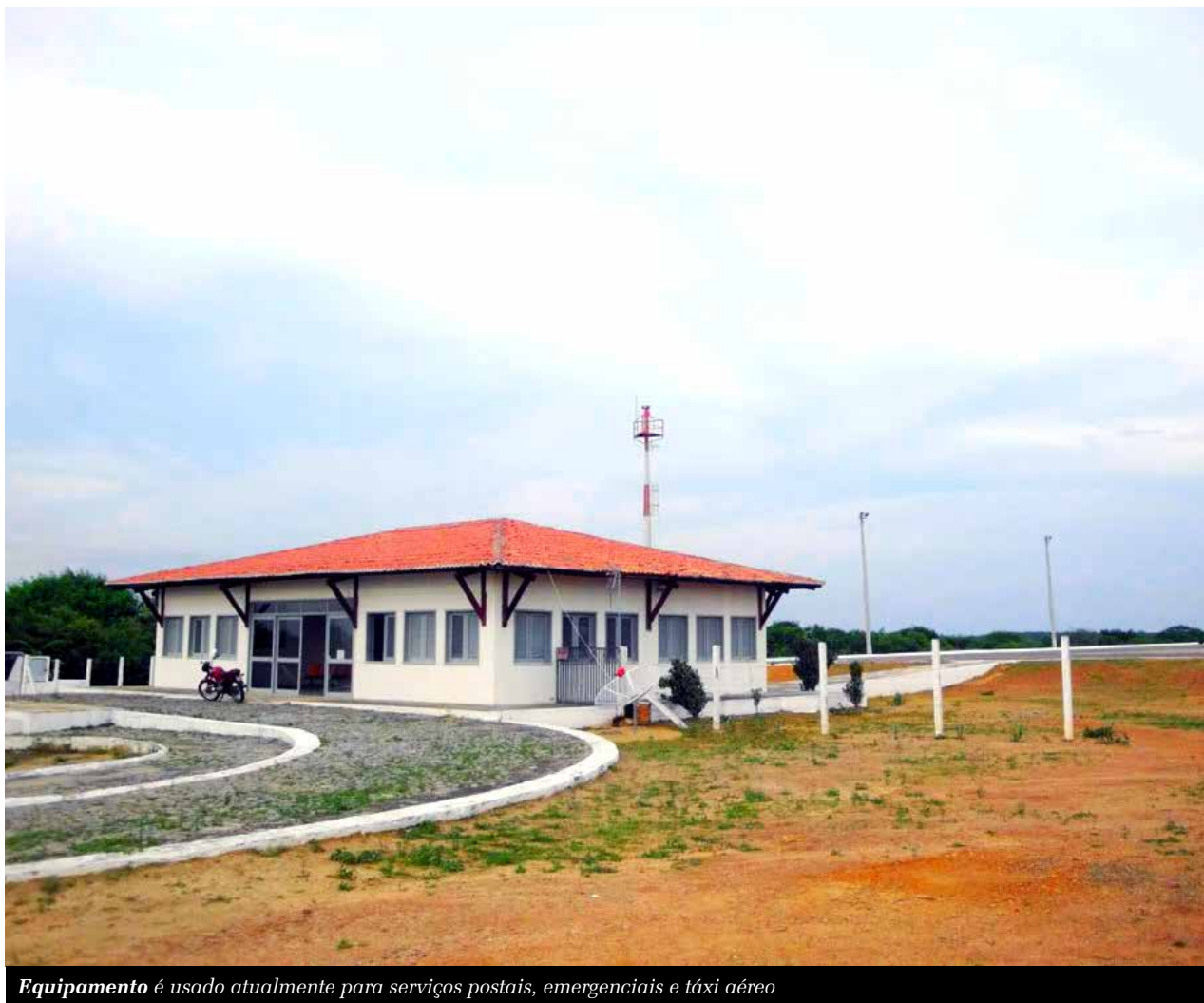
Equipamento é usado atualmente para serviços postais, emergenciais e táxi aéreo