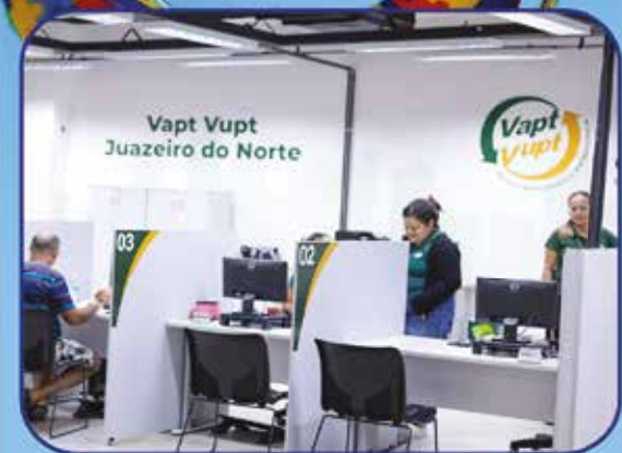
Vapt-Vupt - Setor SEDEST

O agendamento deve ser feito no site meuvaptvupt.com.br , selecionando a unidade de Juazeiro do Norte. A solicitação pode ser realizada pelo próprio beneficiário, tutor ou curador, conforme a necessidade.