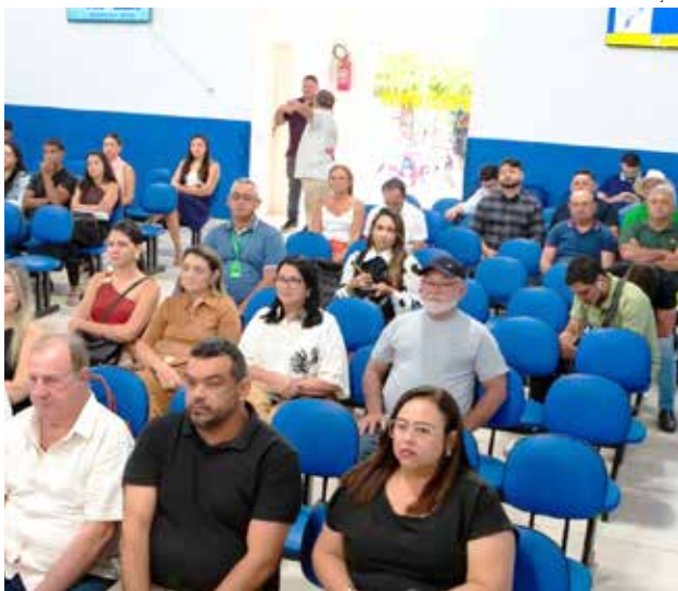
Audiência pública debateu o tema em Lavras da Mangabeira

Robson Roque redacao@jornaldocariri.com.br