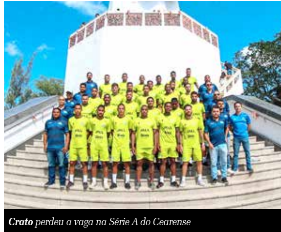
Crato perdeu a vaga na Série A do Cearense

Foi por muito pouco, mas não será desta vez que o torcedor do Crato poderá gritar “é Série A”. A vantagem construída sobre o Quixadá, na ida das semifinais da Série B do Campeonato Cearense, não resistiu ao jogo de volta e o Azulão acabou eliminado. Apesar disso, o time fez campanha acima das expectativas. Começou mal, foi lanterna e por pouco não caiu. Cresceu na hora certa e voltou a mostrar que pode sonhar com mais.