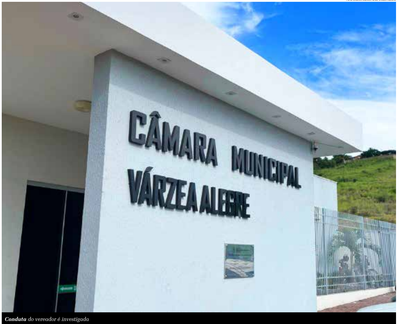
Conduta do vereador é investigada

A presidente destacou, ainda, que a Procuradoria Especial da Mulher da Câmara de Várzea Alegre tem