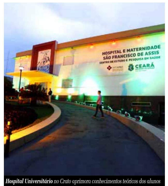
Hospital Universitário no Crato aprimora conhecimentos teóricos dos alunos

Na regional do Crato, os quatro cursos aprovados serão oferecidos pelas seguintes instituições: Faculdade São Camilo do Crato, da União Social Camiliana; Faculdade de Medicina Unileão; Faculdade de Ciências do Cariri, gerida pelo Centro Universitário Unifatec; e Faculdade de Medicina do Crato, mantida pela Fundação José Bonifácio Lafayette de Andrada, sediada em Leopoldina (MG).