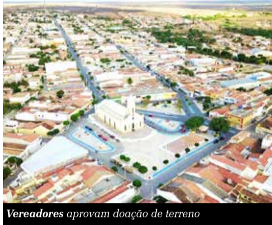
Vereadores aprovam doação de terreno

A Câmara Municipal de Campos Sales recebeu um ofício do Governo do Estado do Ceará, solicitando a aprovação do Projeto de Lei do Executivo nº 03/2025. A matéria trata da doação de um imóvel urbano ao Estado, destinado à construção de uma Escola Estadual de Educação Profissional no Município. A Câmara votou e aprovou, por unanimidade, na última sexta-feira (14), a autorização para a doação do terreno. De acordo com representantes do Legislativo, a aprovação do projeto representa um grande avanço para a educação local, ampliando as oportunidades para os jovens. A nova unidade educacional tem investimento previsto de R$16,7 milhões.