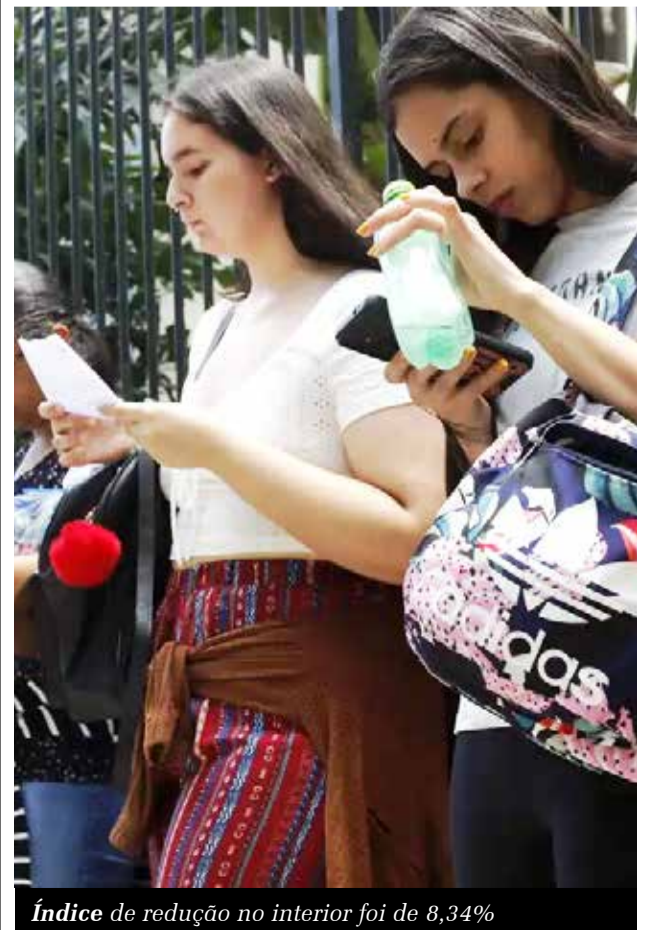
Índice de redução no interior foi de 8,34%