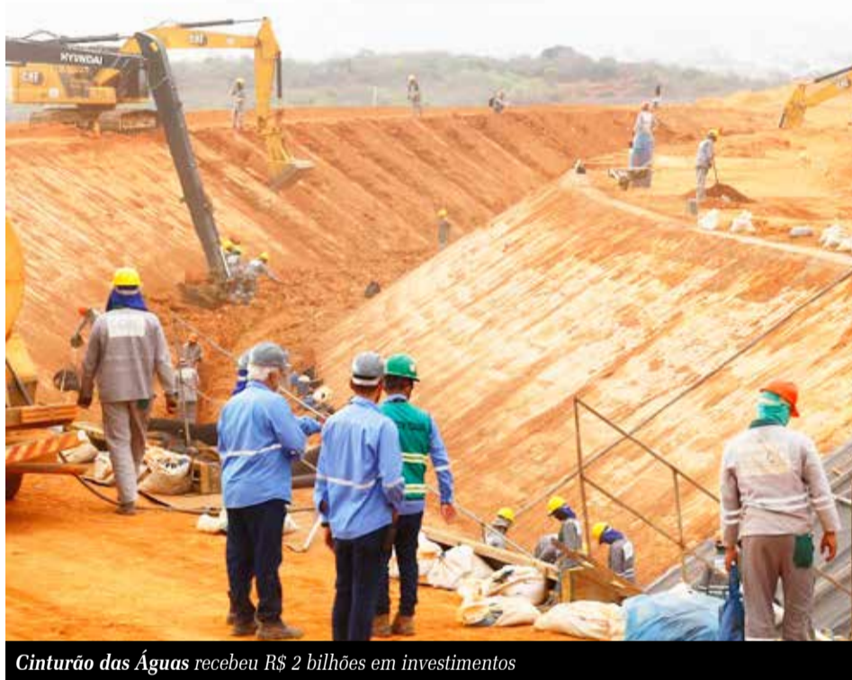
Cinturão das Águas recebeu R$ 2 bilhões em investimentos

R ecursos destinados pelo Governo Federal impulsionam obras hídricas no Cariri. No ano passado foram mais de R$ 2 bilhões revertidos para construções do Cinturão das Águas do Ceará. Com 80% construída, a infraestrutura beneficiará cerca de 4,5 milhões de pessoas com abastecimento no Cariri e na Região Metropolitana de Fortaleza. Ainda foram concluídos dois sistemas de abastecimento em Mauriti, enquanto outros investimentos são previstos para este ano.