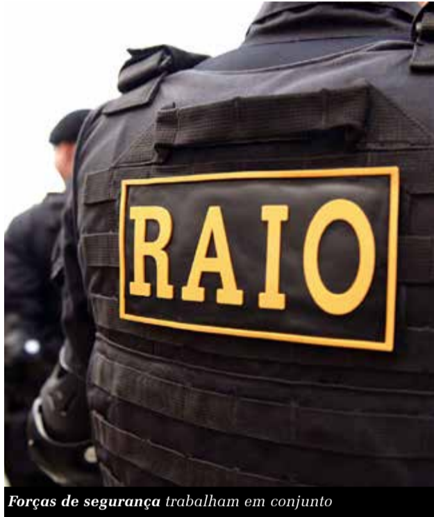
Forças de segurança trabalham em conjunto

criminosas tem sido o principal motivo dos inúmeros homicídios na região do Cariri. Na semana passada, uma ação da Polícia Militar, por meio do Comando de Policiamento de Rondas de Ações Intensivas e Ostensivas (CPRaio), resultou na apreensão de uma arma de fogo no município do Crato. Na arma