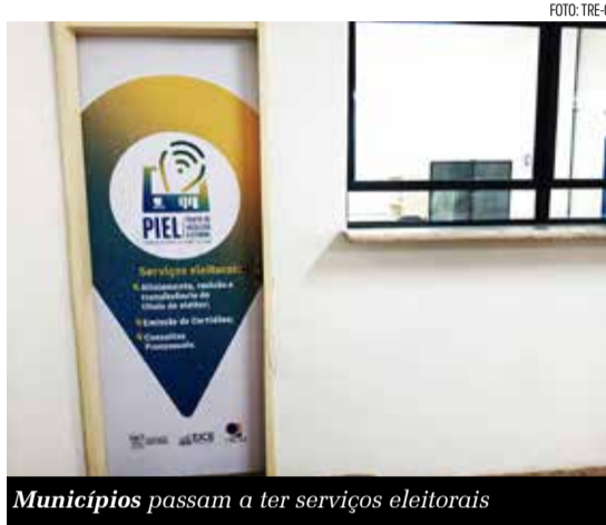
Municípios passam a ter serviços eleitorais