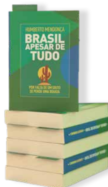
Lançamento aconteceu na última quinta-feira (16)