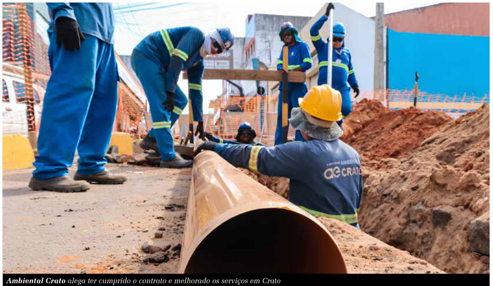
Ambiental Crato alega ter cumprido o contrato e melhorado os serviços em Crato