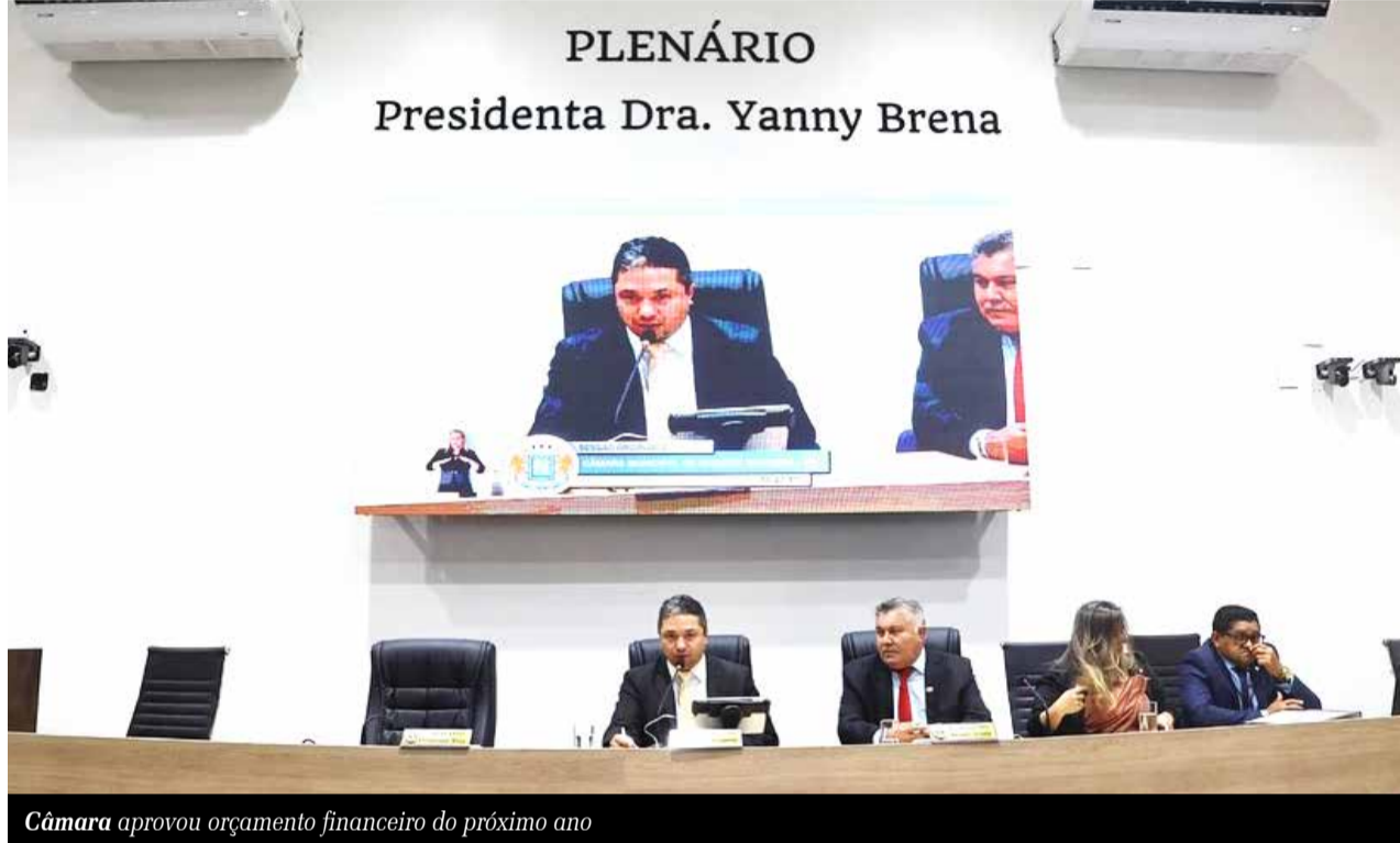
Câmara aprovou orçamento financeiro do próximo ano