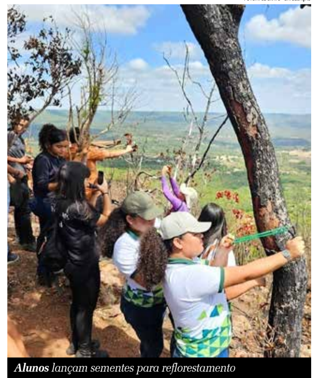
Alunos lançam sementes para reflorestamento

beladas, sobretudo porque o local é de difícil acesso para caminhões do Corpo de Bombeiros. As chamas podiam ser vistas de longe, assim como a cicatriz que ficou visível: o verde das árvores consumidas pelo fogo deram lugar ao paredão rochoso. O Ministério Público do Ceará e a Polícia Civil iniciaram investigações para apurar as causas do incêndio que, para o primeiro órgão, foram criminosas.