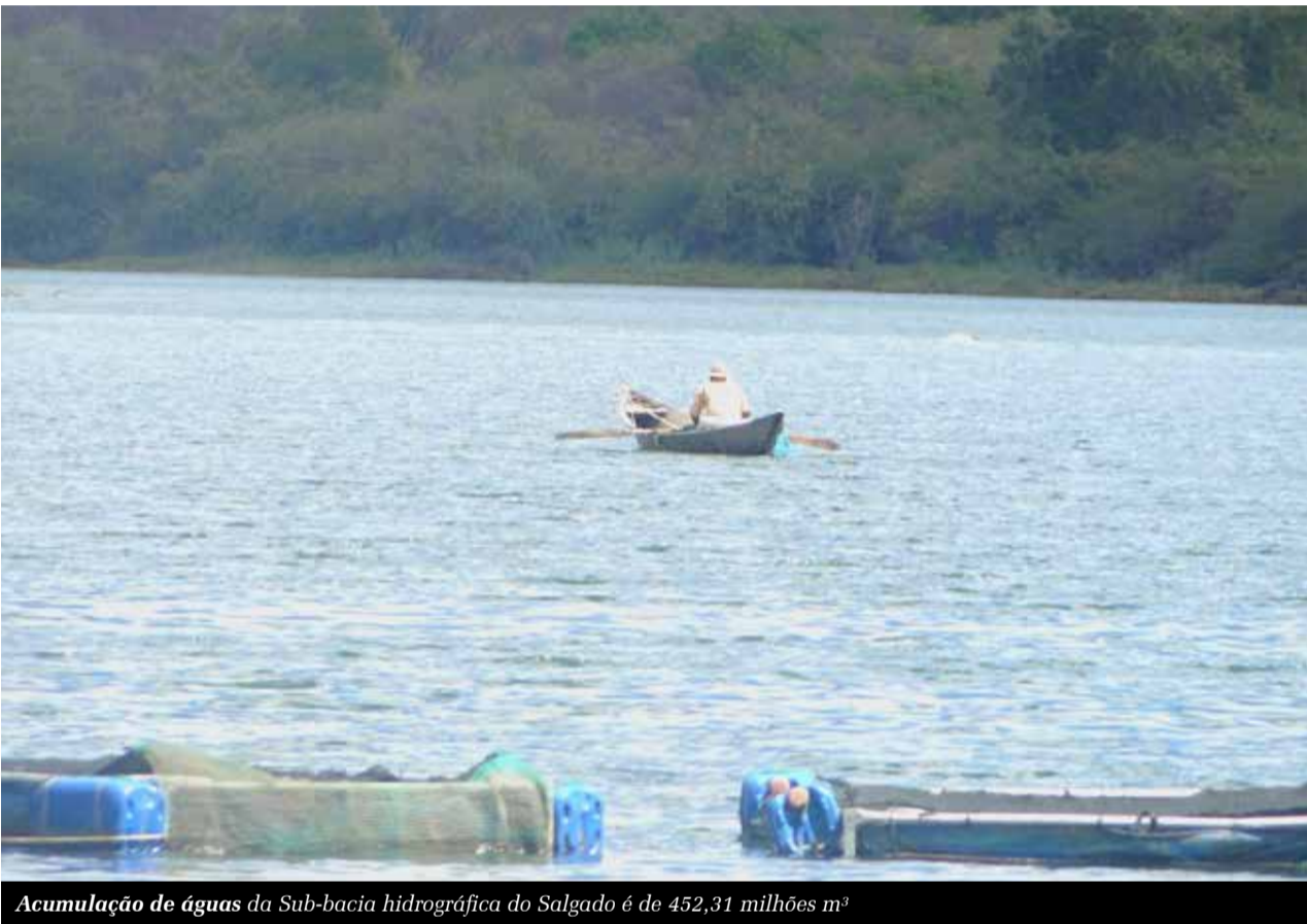
Acumulação de águas da Sub-bacia hidrográfica do Salgado é de 452,31 milhões m 3