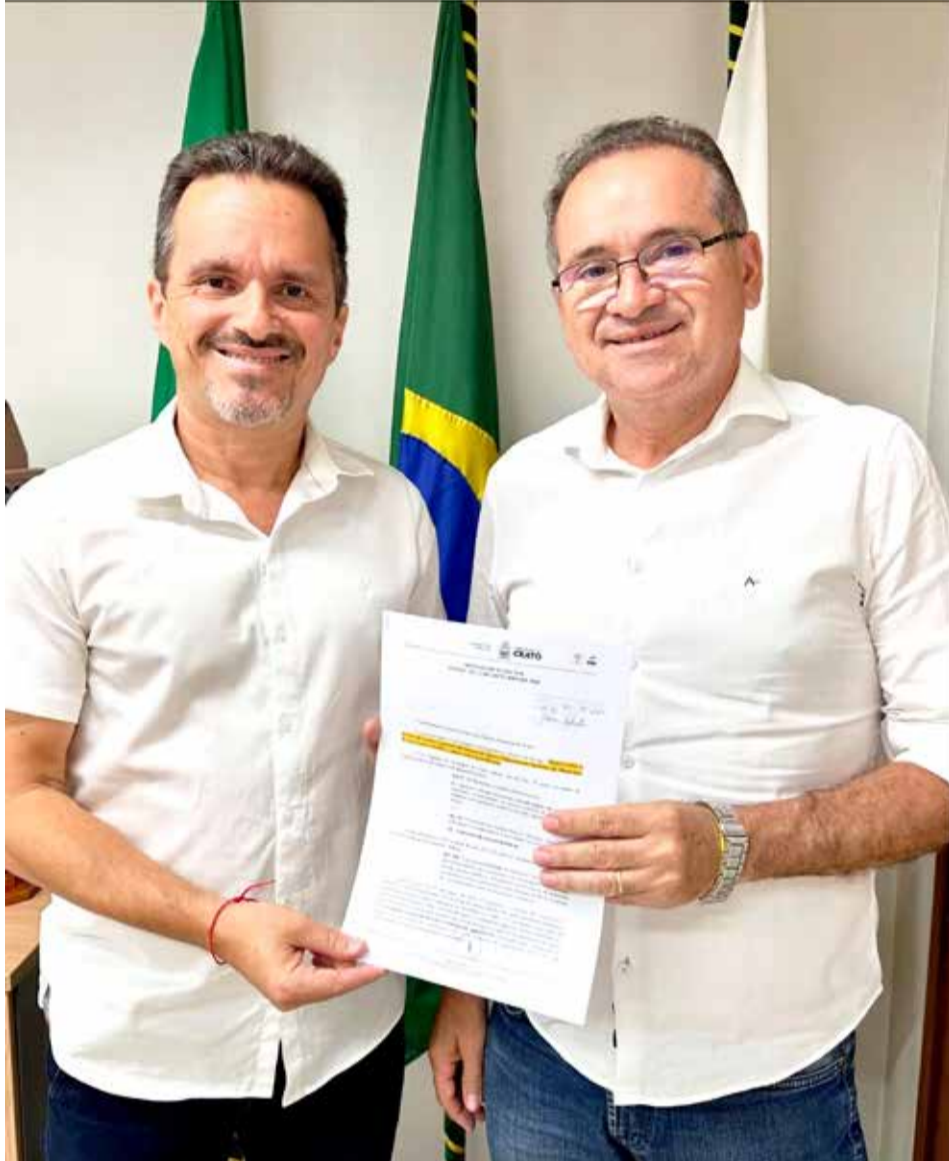
Prazo de 40 dias foi estabelecido para regularização