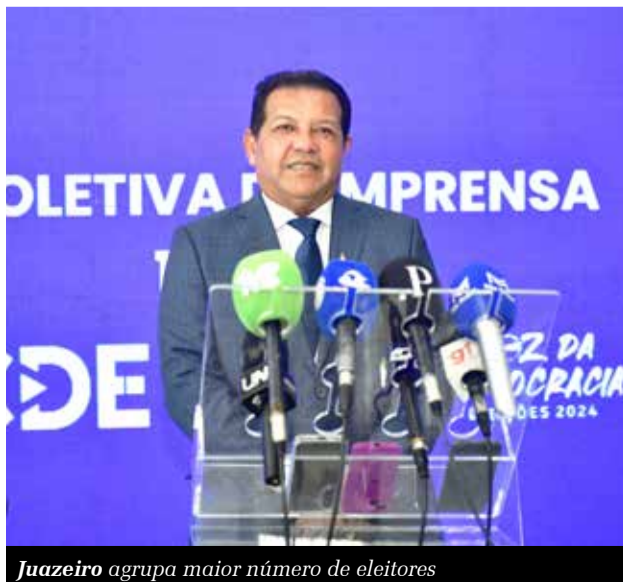
Juazeiro agrupa maior número de eleitores

Dez municípios do Cariri somam 551.957 eleitores aptos a votar nas eleições municipais de 2024, de acordo com dados do Tribunal Regional Eleitoral do Ceará (TRE-CE). Mais de 350 mil votantes se concentram apenas no Crajubar, com 199.128 em Juazeiro do Norte, 95.267 em Crato e