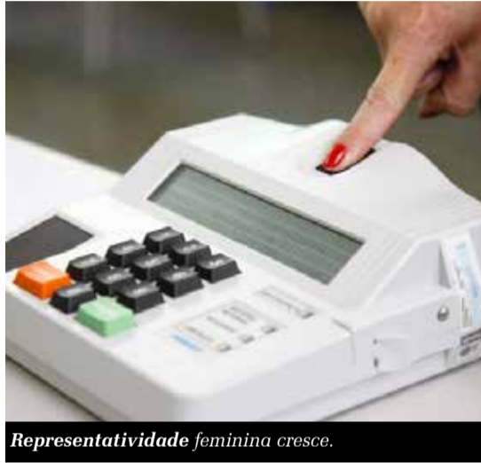
Representatividade feminina cresce.

Quatro municípios da Região Metropolitana do Cariri tiveram aumento na representatividade feminina no Legislativo. Juazeiro do Norte escolheu uma mulher a mais. Foram três em 2020 e quatro eleitas neste domingo (06). Crato e Missão Velha elegeram uma mulher a mais. São duas em cada município na atual legislatura e serão três em cada, a partir de 2025. Jardim terá duas vereadoras a mais. Lá, Câmara tem, atualmente, uma vereadora. No ano que vem serão três. O quadro atual nesses municípios é composto por sete vereadoras. Agora, juntas, as cidades contabilizam nove nomes. Os outros municípios que compõem a RMC - Nova Olinda, Caririçu, Farias Brito, Barbalha e Santana do Cariri - não registraram aumento de mulheres no Legislativo.