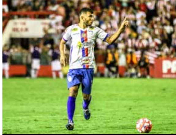
Guarani inicia buscas por reforços para a Série B do Cearense