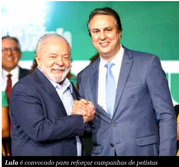
Lula é convocado para reforçar campanhas de petistas

Da Redação redacao@jornaldocariri.com.br