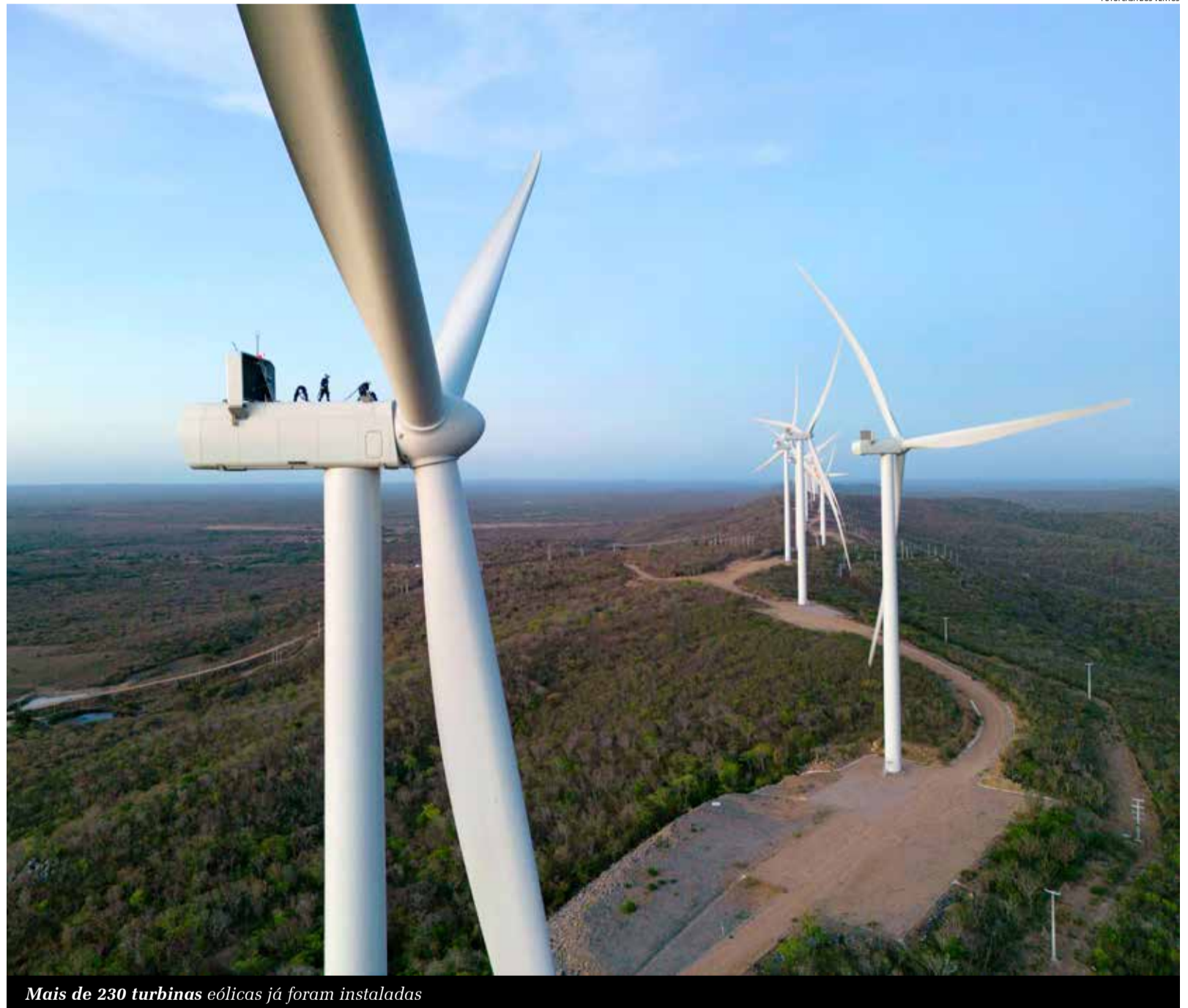
Mais de 230 turbinas eólicas já foram instaladas

Cerca de 230 turbinas eólicas foram instaladas nas divisas entre os três estados, sobretudo em Araripe (PE), Currais Novos e Simões (PI). Ainda é prevista a instalação de um parque fotovoltaico. Segundo a ONG Conectas Direitos Humanos, o estudo de campo “demonstra