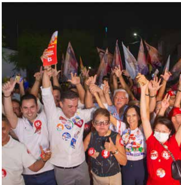
Fernando Santana destaca o apoio de Lula e Camilo

Com o rompimento da aliança entre PT e PDT, ressaltam-se dois grupos políticos no Ceará: um liderado por Camilo Santana (PT), com o apoio de Cid Gomes (que trocou o PDT pelo PSB); outro que tem Ciro Gomes à frente. As duas correntes políticas miram o Cariri e, sobretudo, o Crajubar, como prioridades, inclusive de olho no próximo pleito estadual.