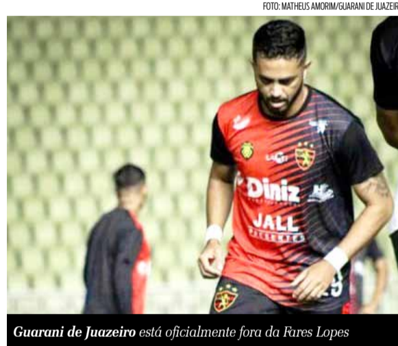
Guarani de Juazeiro está oficialmente fora da Fares Lopes

Os times do Cariri estão fora da Taça Fares Lopes em 2024. Icasa, Guarani de Juazeiro e Barbalha alegaram dificuldades financeiras para justificar a ausência. O Cariri, por outro lado, optou por não participar para focar na montagem do elenco para a Série A do Campeonato Cearense de 2025. Com isso, a torcida caririense terá que apoiar o Iguatu, único representante do interior na competição, que carrega as esperanças da região.