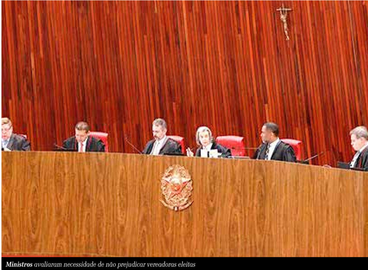
Ministros avaliaram necessidade de não prejudicar vereadoras eleitas