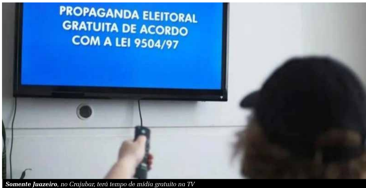
Somente Juazeiro, no Crajubar, terá tempo de mídia gratuito na TV

disse que a estratégia é focar na necessidade de mudança de projeto e nas alianças, mas avalia que essa estratégia pode ser ajustada conforme a necessidade da campanha.