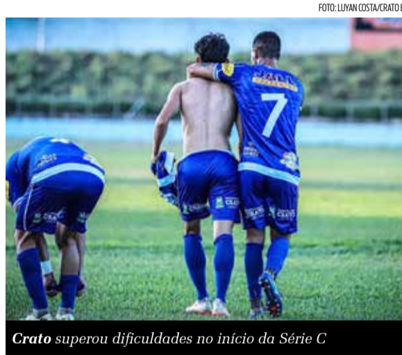
Crato superou dificuldades no início da Série C

A sina do Crato, sem conquistar títulos no futebol profissional, continua. O Azulão esteve muito próximo de quebrar o tabu, mas perdeu a taça da Série C do Campeonato Cearense para o Quixadá. A derrota mantém o jejum de títulos, reforçando que, na região caririense, apenas Campo Grande, Guarani de Juazeiro e Icasa possuem conquistas no futebol profissional, enquanto o Crato segue mais uma temporada em busca da primeira taça.