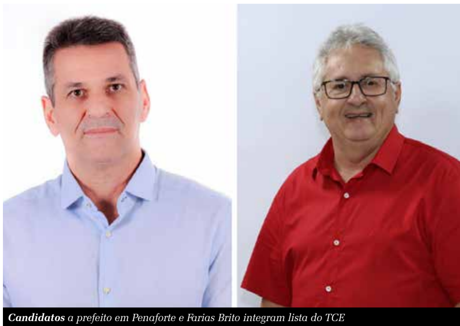
Candidatos a prefeito em Penaforte e Farias Brito integram lista do TCE