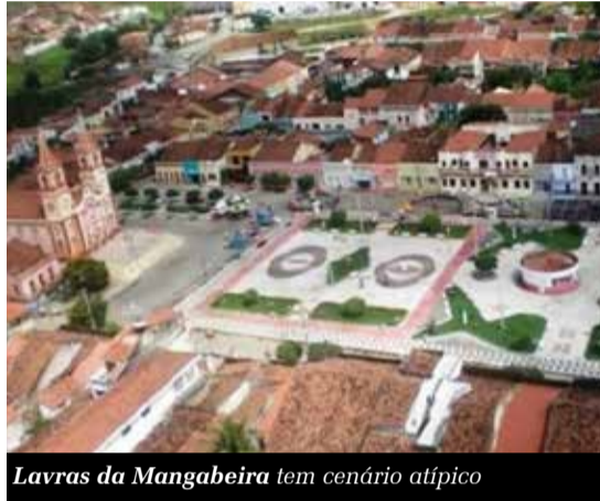
Lavras da Mangabeira tem cenário atípico