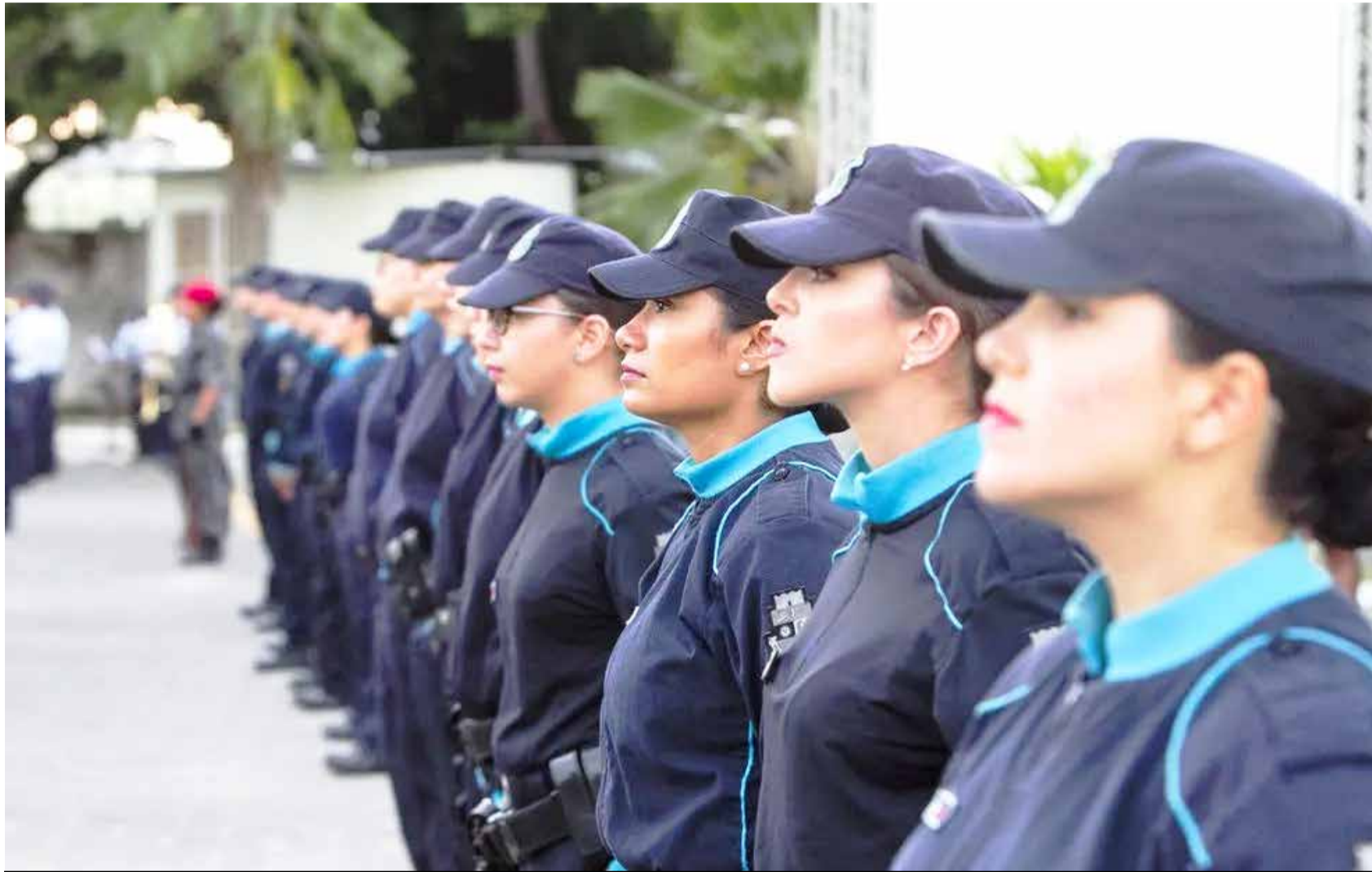
Mulheres representam quase 13% do efetivo da Polícia Militar cearense

D e acordo com dados recentes, divulgados pelo Fórum de Segurança Pública, as mulheres representam 12,8% do efetivo da Polícia Militar. Os números colocam em evidência o déficit desse gênero atuando na profissão, quando comparada à quantidade de homens ocupando o cargo. No Ceará, a Polícia Civil do Estado (PCCE) atua com 1.191 policiais femininas, sendo 163 delegadas, 474 escrivãs e 554 inspetoras. Já o efetivo de policiais militares conta com 1.500 mulheres em todo Estado. Destas, 46 fazem a segurança na região do Cariri.