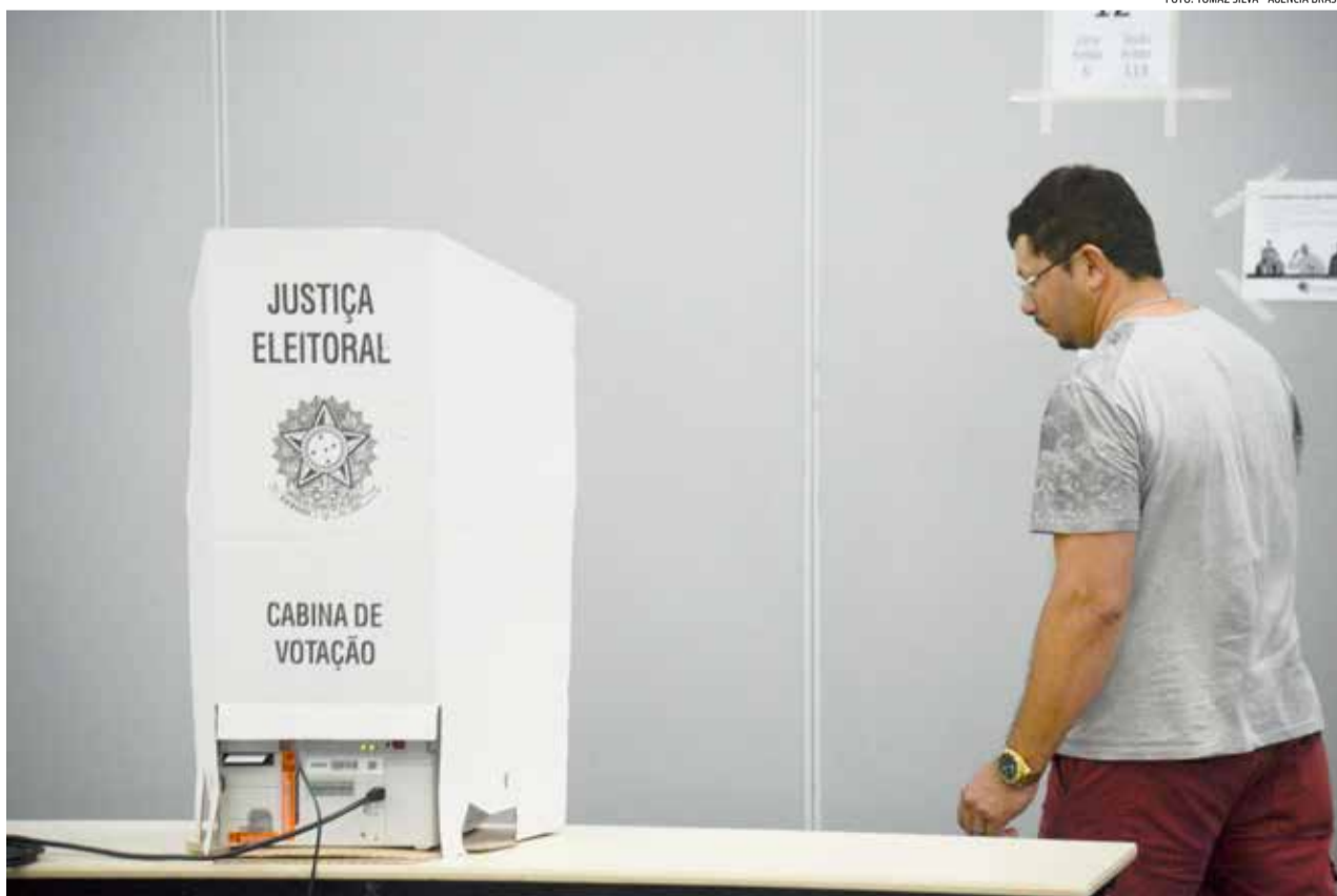
Alteração de domicílio eleitoral é uma das explicações para a discrepância entre eleitores e habitantes