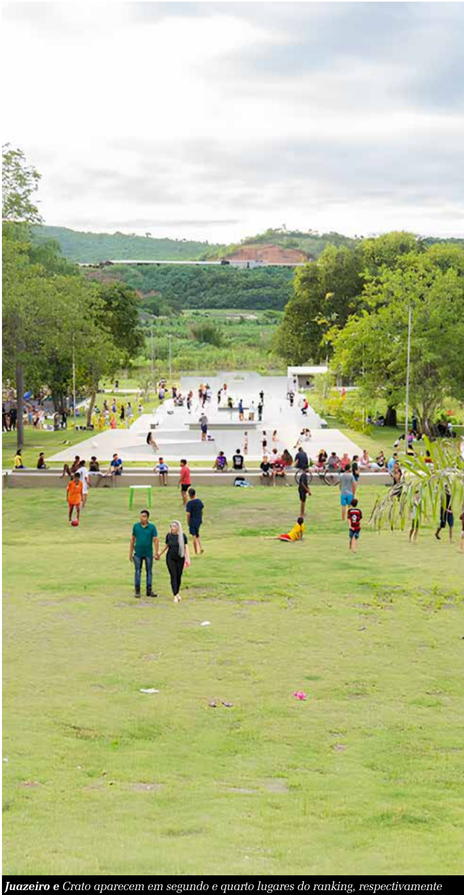
Juazeiro e Crato aparecem em segundo e quarto lugares do ranking, respectivamente

Segundo o IPS, progresso social é a “capacidade da sociedade em satisfazer as