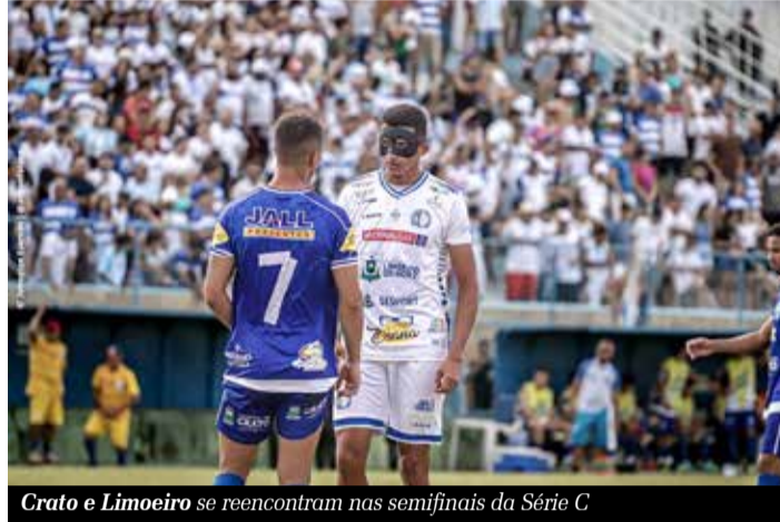
Crato e Limoeiro se reencontram nas semifinais da Série C

O Crato enfrenta uma difícil missão nas semifinais da Série C do Campeonato Cearense: superar o Limoeiro. No último confronto, o adversário saiu vitorioso. Contudo, a realidade, agora, é diferente. É um campeonato à parte. Para retornar à Série B, o Crato precisa deixar o passado no passado e se concentrar no presente. A equipe terá que demonstrar poder de superação para reverter o histórico e alcançar o tão sonhado acesso.