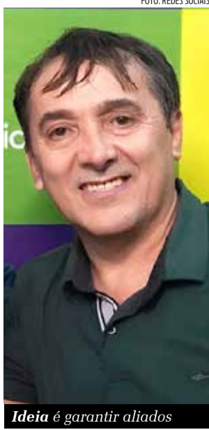
Ideia é garantir aliados