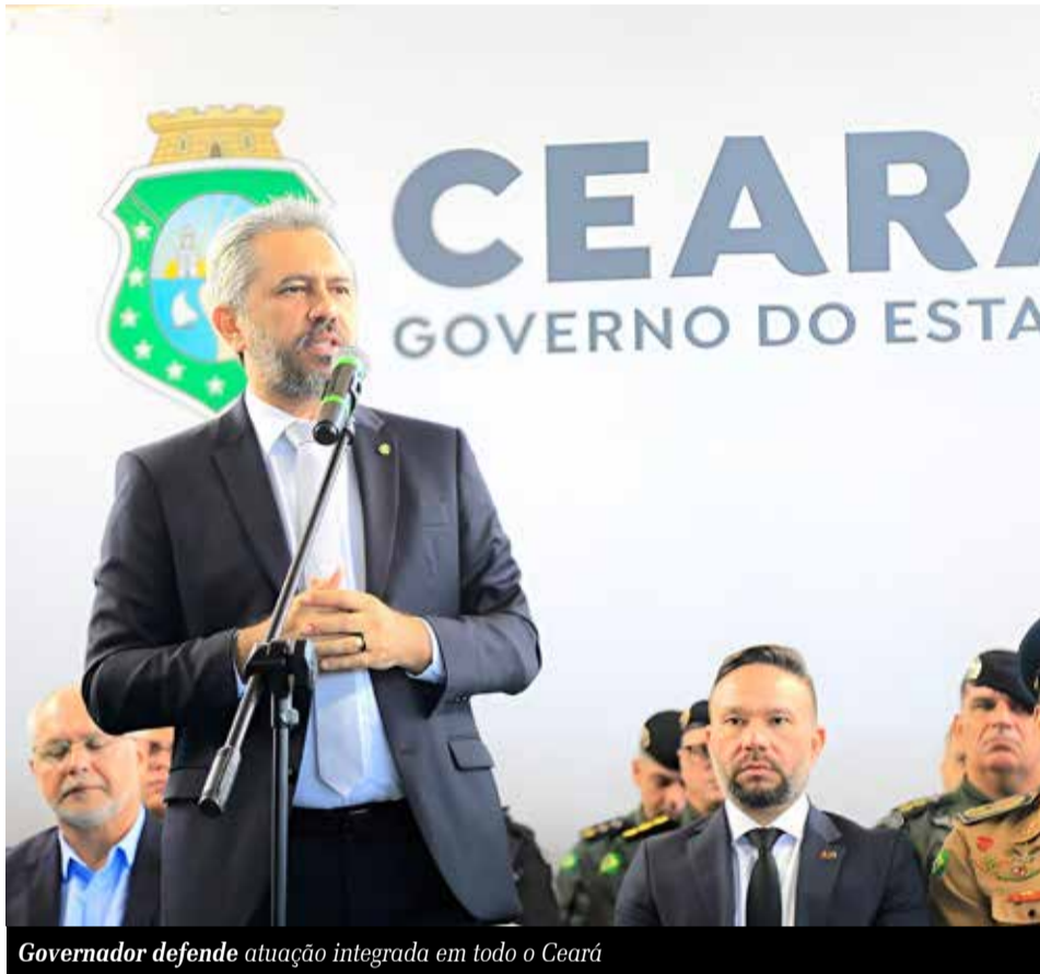
Governador defende atuação integrada em todo o Ceará