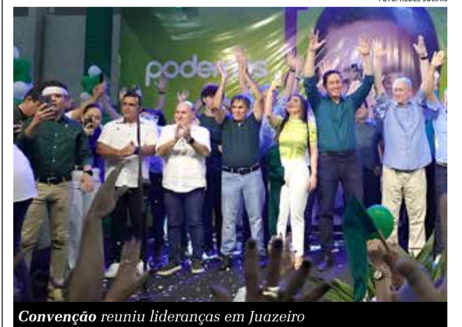
Convenção reuniu lideranças em Juazeiro