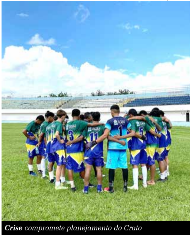
Crise compromete planejamento do Crato