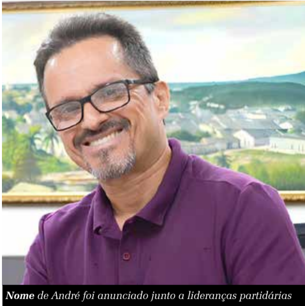
Nome de André foi anunciado junto a lideranças partidárias

Outras ações como reuniões com os pré-candidatos, presidentes dos partidos, além de conversas com membros da sociedade civil, também foram relacionadas por Zé Ailton. O resultado foi avaliado conjuntamente, com as lideranças do Estado, como o ministro Camilo Santana (PT), o governador Elmano de Freitas (PT) e o deputado federal José Guimarães (PT).