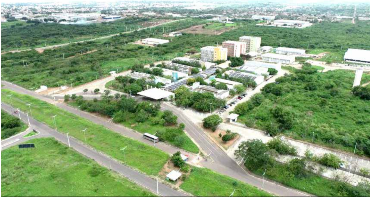
Equipamento de saúde será instalado próximo ao campus da UFCA