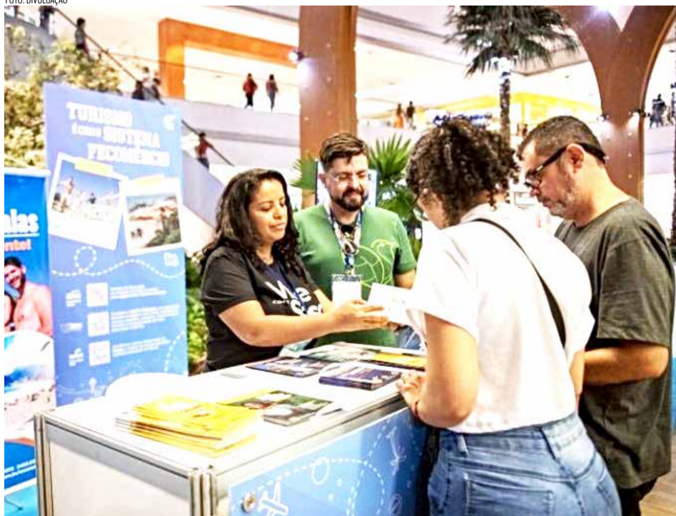
Destinos do próprio Ceará serão estimulados

Joaquim Júnior redacao@jornaldocariri.com.br