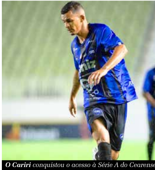
O Cariri conquistou o acesso à Série A do Cearense

O Cariri, fundado em 2019, surpreendeu o futebol cearense, ao garantir uma vaga na Série A do Campeonato Cearense de 2025. Sem brilhar na primeira fase, o clube foi eficiente nos momentos cruciais. Nos duelos contra Guarani de Juazeiro e Icasa, o Cariri provou ser um verdadeiro demolidor de gigantes, superando expectativas e adversários com mais tradição. Essa conquista eleva o status do clube, que agora vai em busca do título.