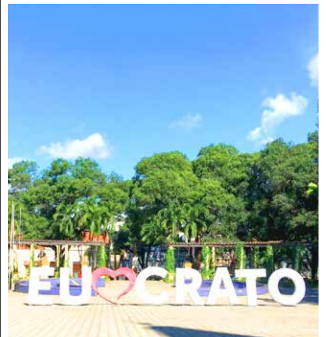
Diálogos serão retomados esta semana