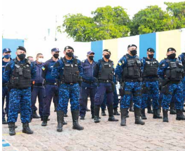
GCM efetua patrulhamento nos bairros de Juazeiro

A Guarda Civil Municipal de Juazeiro do Norte (GCM) está na iminência de receber o armamento para exercer trabalhos de forma mais segura. O Município efetuou a compra de 25 pistolas de calibre 9 mm (restrito para forças policiais e Exército) e 21 mil munições, sendo 20 mil para treinos e mil para serviço da própria Guarda. Com curso de formação em andamento, 70 agentes