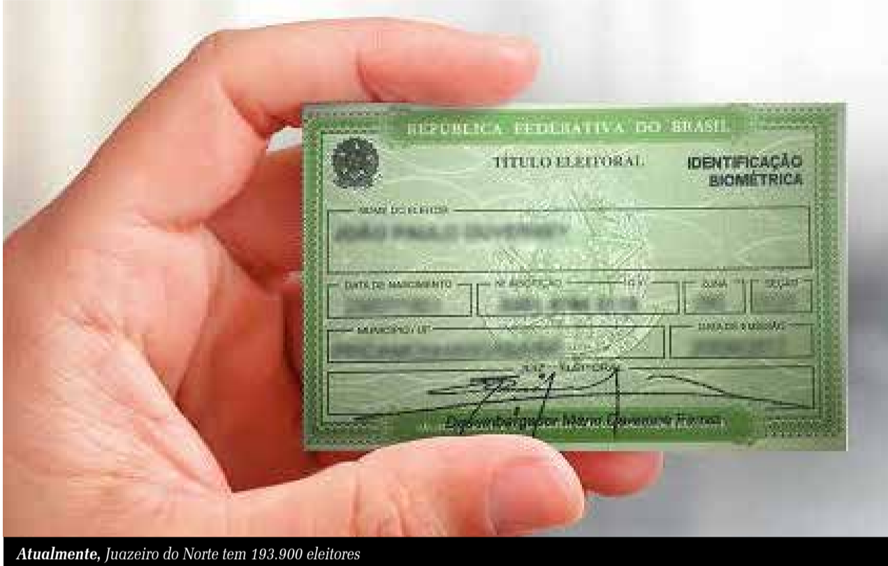
Atualmente, Juazeiro do Norte tem 193.900 eleitores