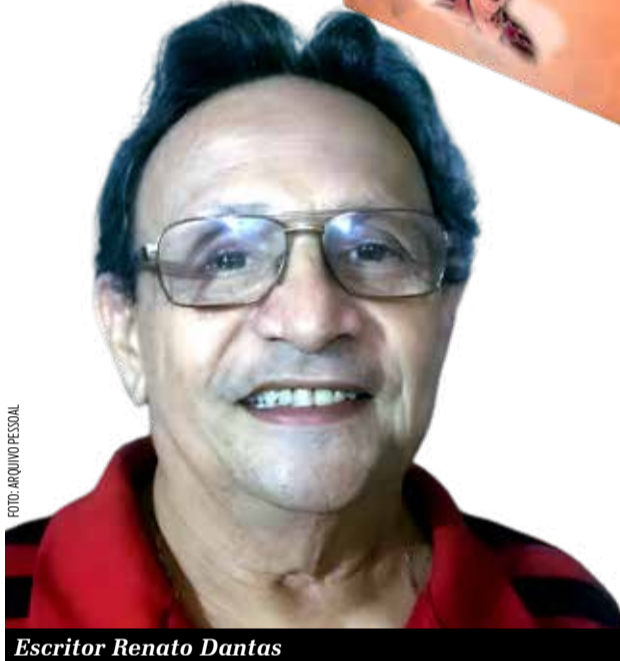
Escritor Renato Dantas