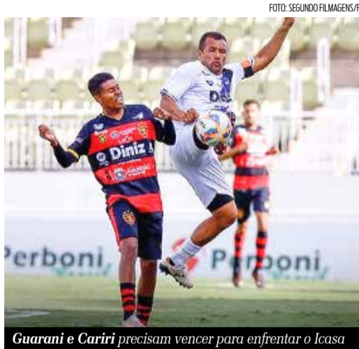
Guarani e Cariri precisam vencer para enfrentar o Icasa

O equilíbrio entre Guarani de Juazeiro e Cariri se mostra insistente na Série B estadual. Dois confrontos, um na fase classificatória (1 a 1) e outro na primeira partida válida pelas quartas de final (0 a 0), refletiram a paridade de forças. Contudo, no próximo encontro, nesta quinta-feira (11), encerrar - a partida - na igualdade não será opção: um dos times precisa vencer para seguir com o sonho de alcançar a elite.