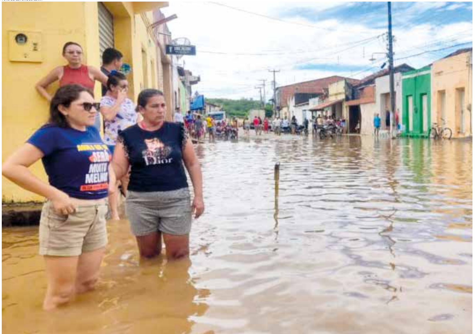
Localidades ficaram alagadas e moradores tiveram dificuldade até no deslocamento

Em Crato, o alto volume de chuvas causou transtorno em pontos como o distrito de Dom Quintino e no Centro comercial, onde foram realizadas intervenções com o intuito de restabelecer a normalidade. “O objetivo da Defesa Ci-