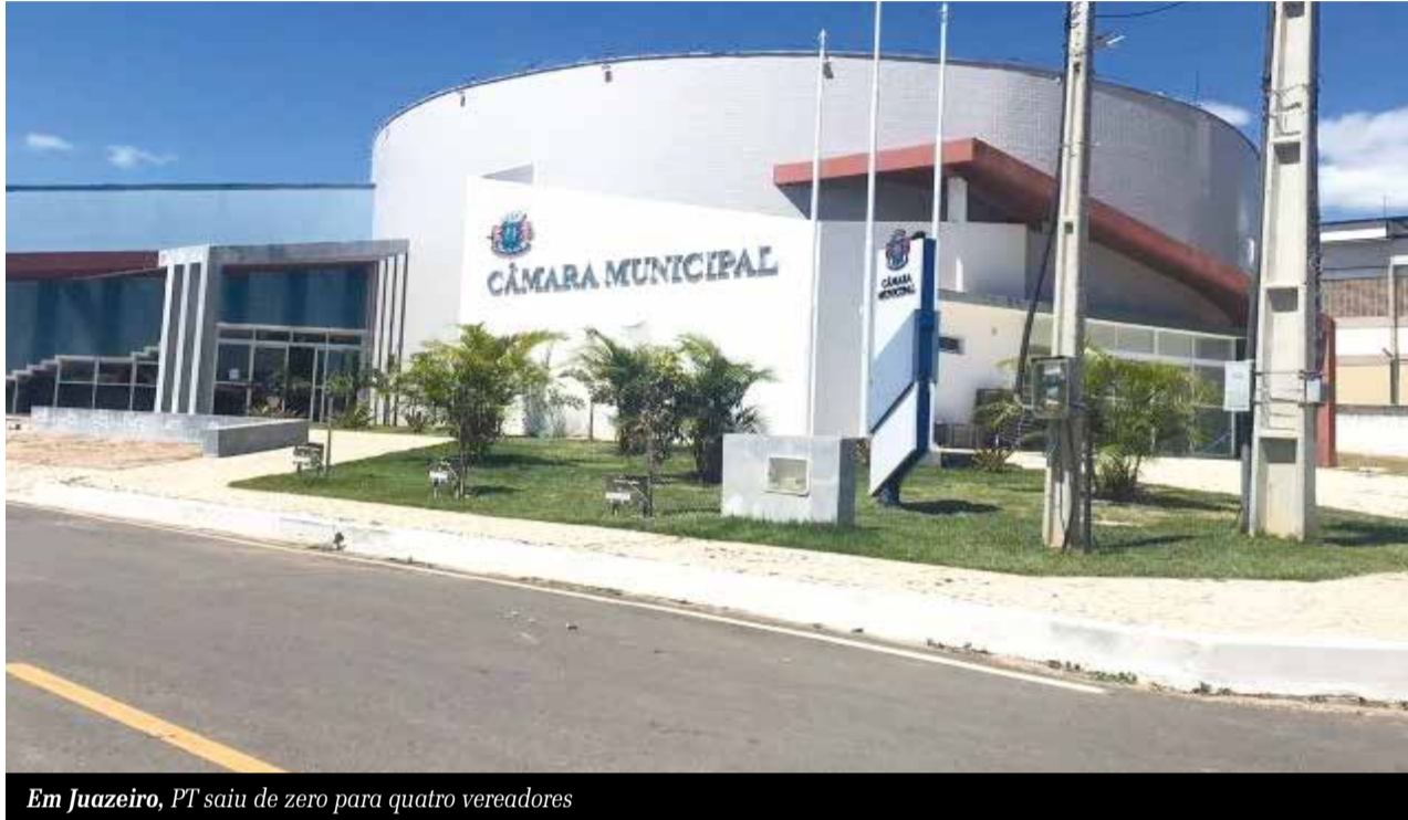
Em Juazeiro, PT saiu de zero para quatro vereadores