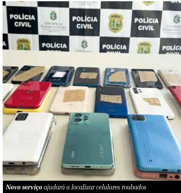
Novo serviço ajudará a localizar celulares roubados

Processo similar é realizado pelas delegacias do Cariri, a exemplo de Crato, Juazeiro do Norte e Barbalha. Em Juazeiro, o trabalho é feito pelo Núcleo de Roubos, Furtos e Recepção. A vítima vai à delegacia, efetua o B.O (Boletim de Ocorrência), registra o número do IMEI e, em seguida, o documento é passado para o núcleo responsável, que atua junto às operadoras para identificar o aparelho. Após o rastreamento, as