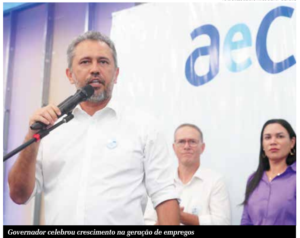
Governador celebrou crescimento na geração de empregos