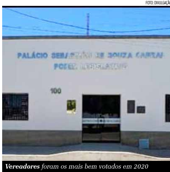
Vereadores foram os mais bem votados em 2020