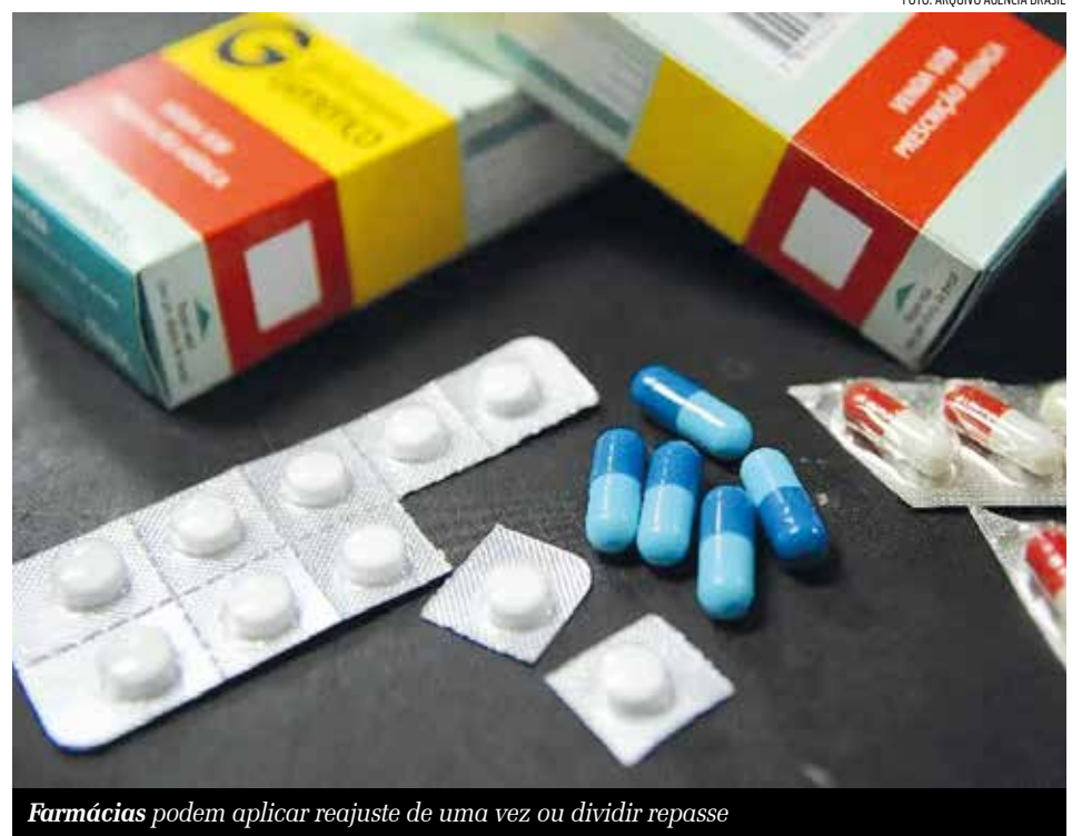
Farmácias podem aplicar reajuste de uma vez ou dividir repasse