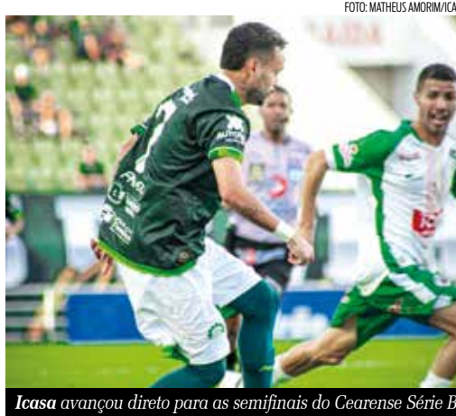
Icasa avançou direto para as semifinais do Cearense Série B

O Icasa finalizou a primeira fase da Série B do Campeonato Cearense com um desempenho notável, assegurando a liderança e uma vaga direta para as semifinais. Enquanto seus adversários ainda lutam por uma chance, o Icasa já tem seu lugar garantido, podendo observar de camarote a disputa intensa pelas outras três vagas. Agora, o time se concentra e se prepara meticulosamente para os dois confrontos decisivos que se aproximam.