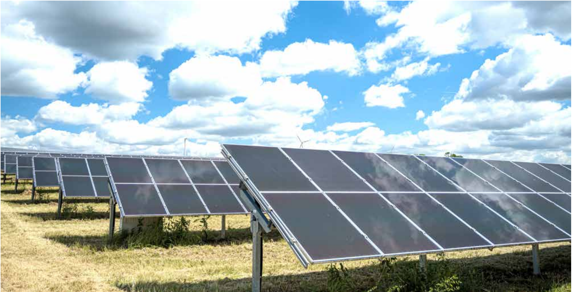
Comunidades e ecossistemas têm sido afetados devido à instalação de empreendimentos