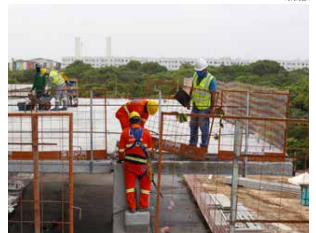
Serão investidos R$ 45 bilhões em obras da Educação