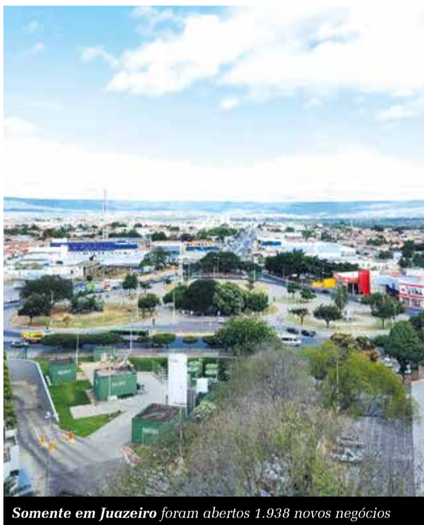
Somente em Juazeiro foram abertos 1.938 novos negócios

indústria). Os números são da Junta Comercial do Ceará (Jucec).