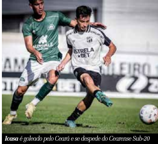
Icasa é goleado pelo Ceará e se despede do Cearense Sub-20

O Icasa sofreu uma eliminação dolorosa. Olhar só para o placar não é suficiente para avaliar o potencial do elenco. É inegável que a goleada por 6 a 1 levanta questionamentos. Contudo, o Icasa enfrentou o Ceará, que possui um trabalho de base consolidado. Desenvolver uma base sólida exige investimento, e, sobretudo, tempo. O caminho para o sucesso é repleto de vitórias e derrotas, e esta eliminação é apenas um capítulo nessa jornada.