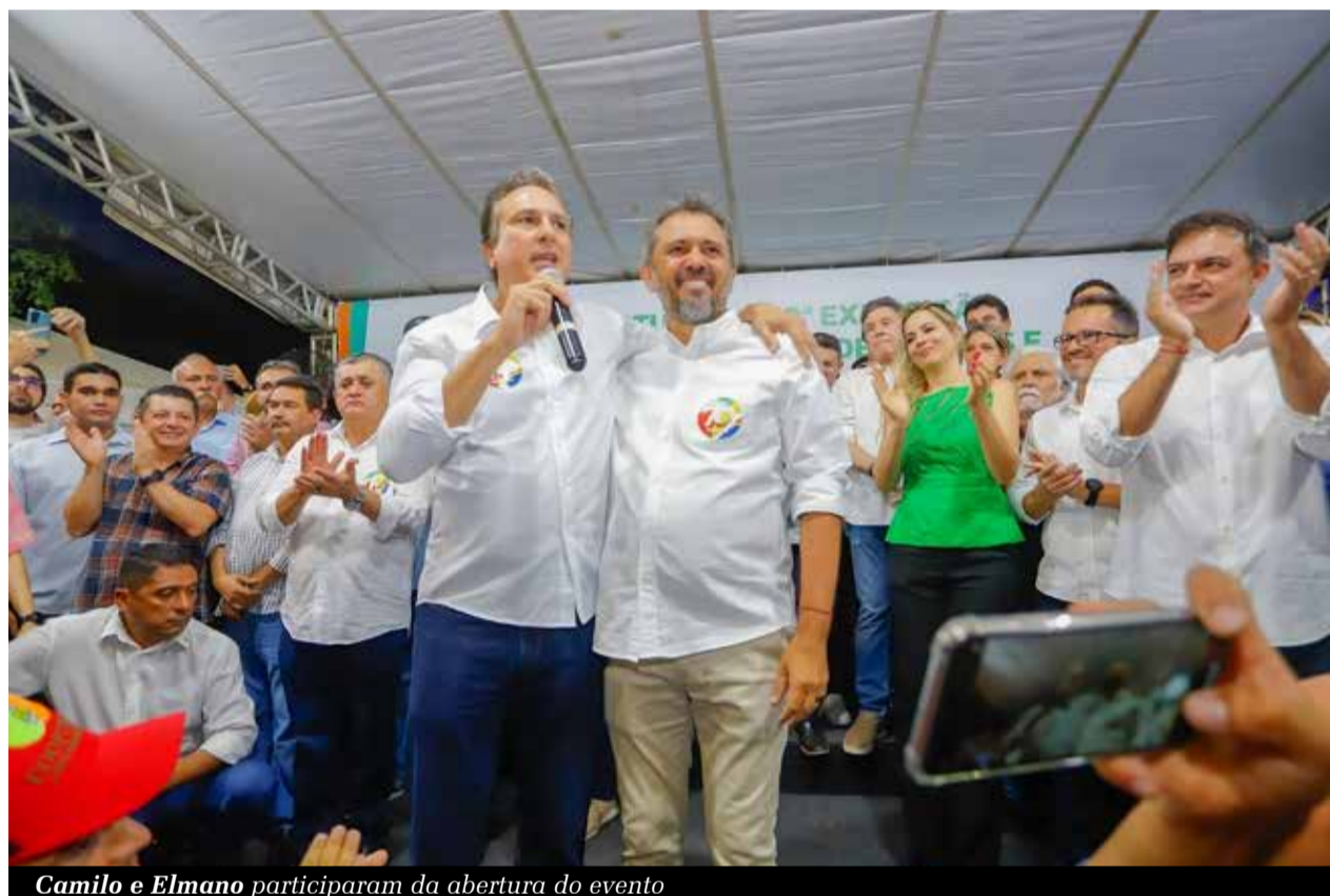
Camilo e Elmano participaram da abertura do evento

Paulo Câmara ressaltou a determinação do governo Lula, em fazer com que o crédito chegue a todos.