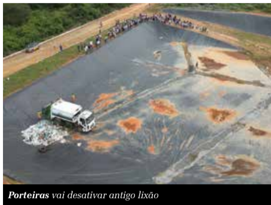
Porteiras vai desativar antigo lixão