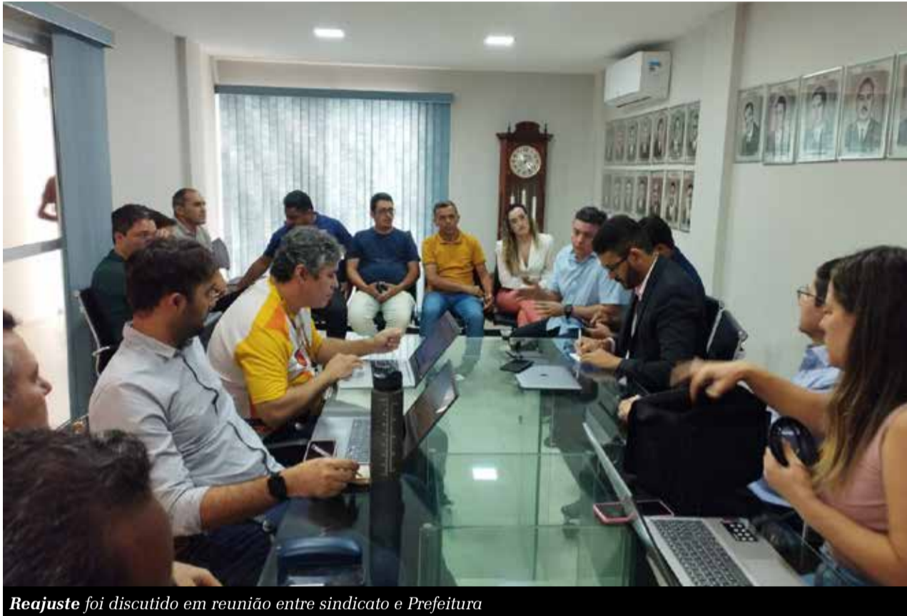
Reajuste foi discutido em reunião entre sindicato e Prefeitura