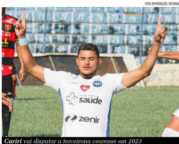
Cariri vai disputar a terceira cearense em 2023