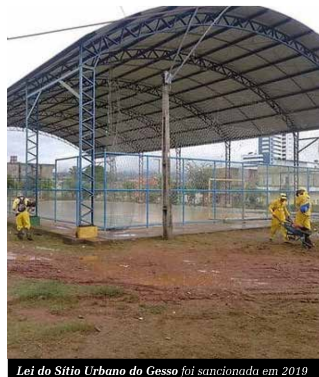
Lei do Sítio Urbano do Gesso foi sancionada em 2019