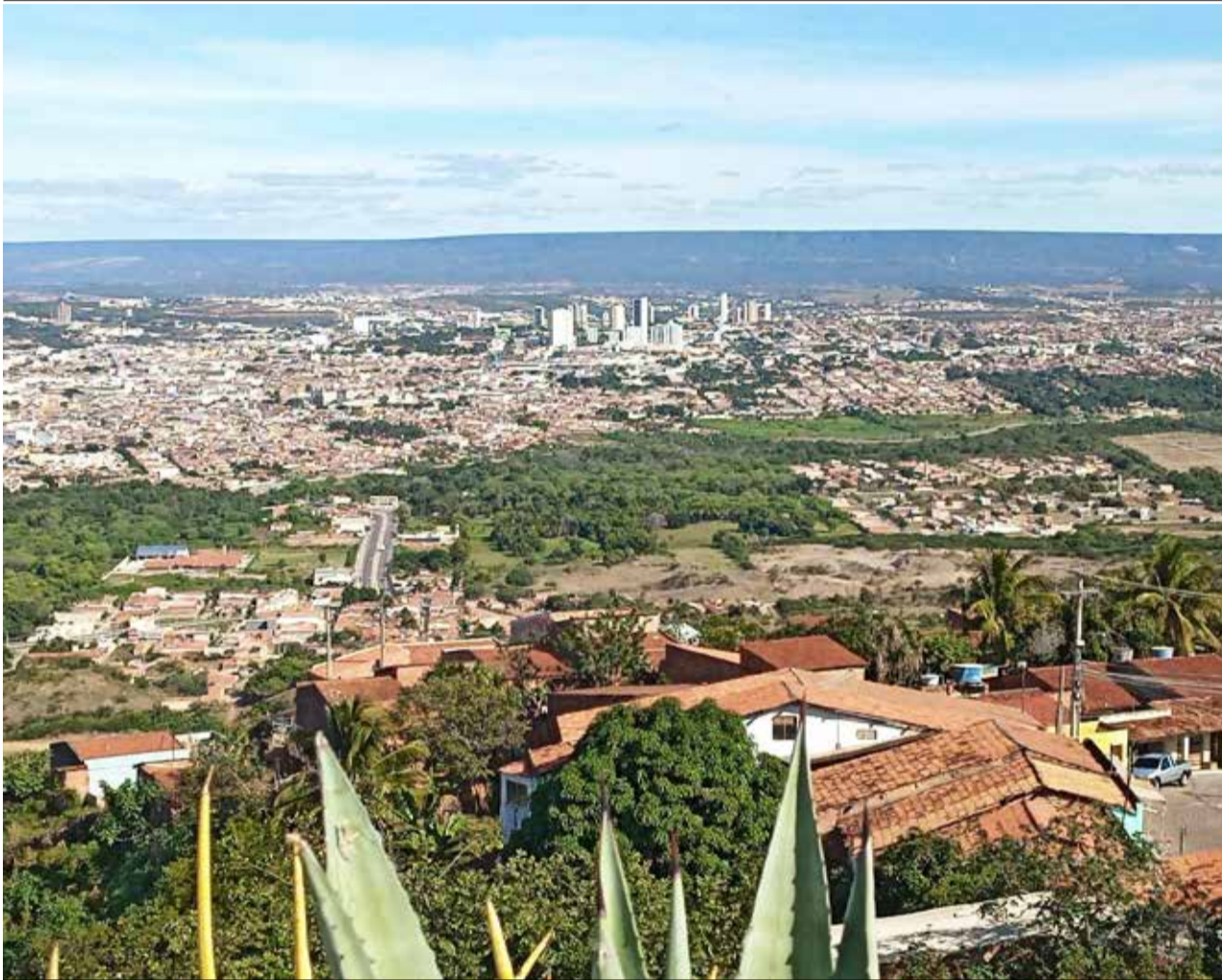
Hoje, nove municípios compõem a RMC