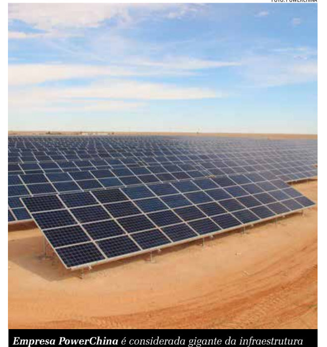
Empresa PowerChina é considerada gigante da infraestrutura