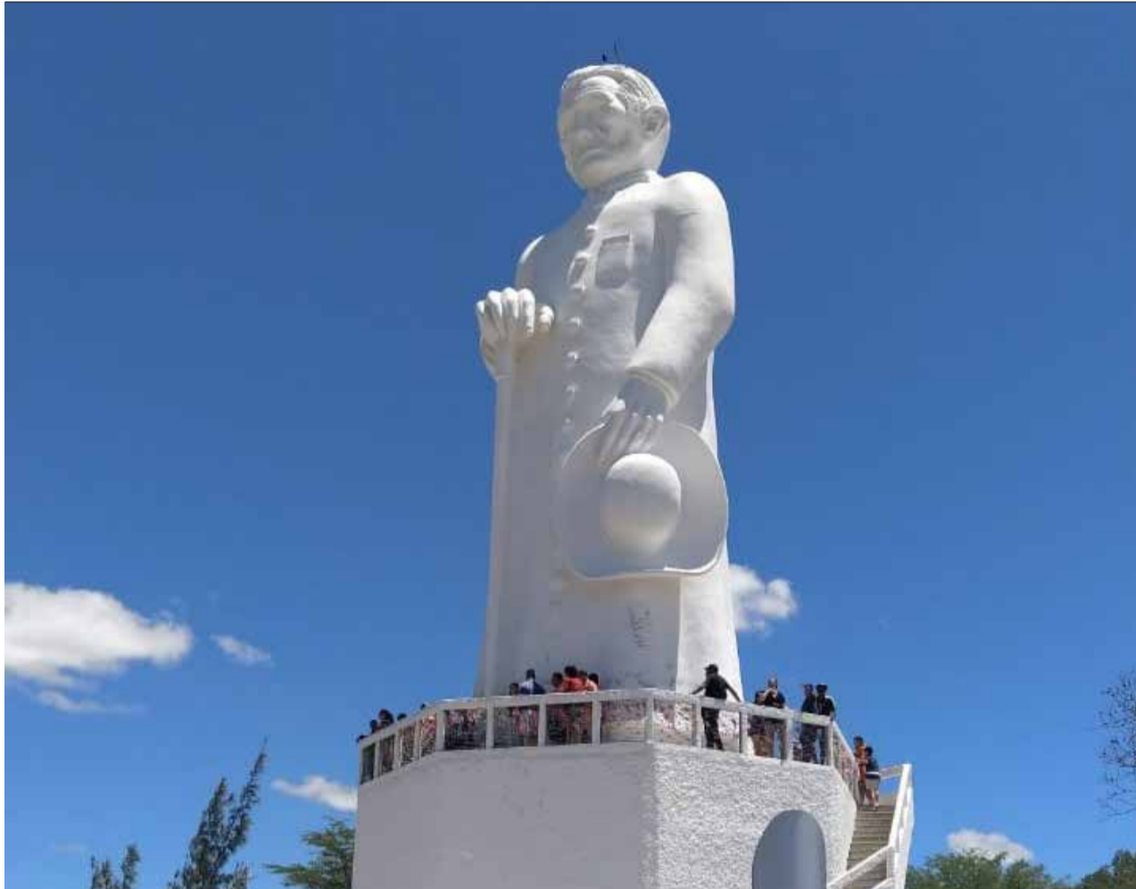
Livro contém nome de personalidades que marcaram a história do Brasil