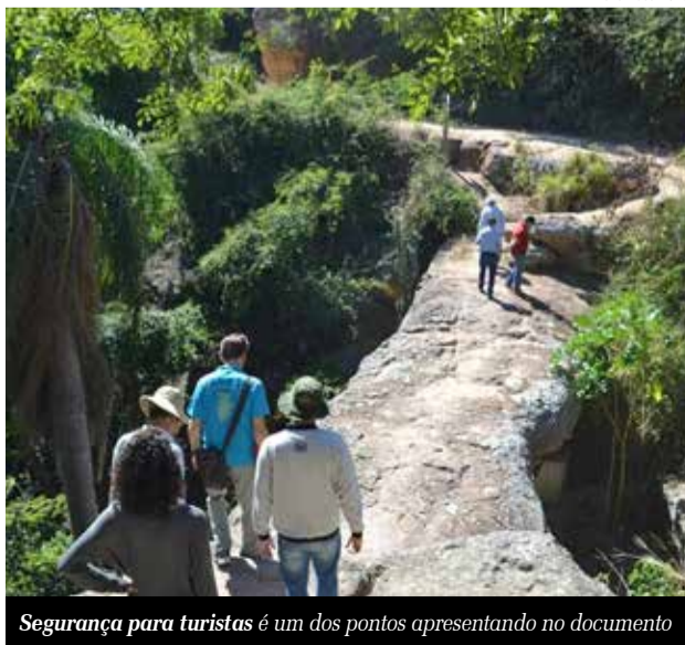
Segurança para turistas é um dos pontos apresentando no documento