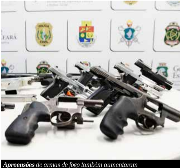
Apreensões de armas de fogo também aumentaram

Os registros de violência no Cariri referentes ao primeiro trimestre do ano, quando comparados ao mesmo período do ano passado, apontam aumento dos índices em diferentes tipos de crimes. Conforme informações disponíveis pelo