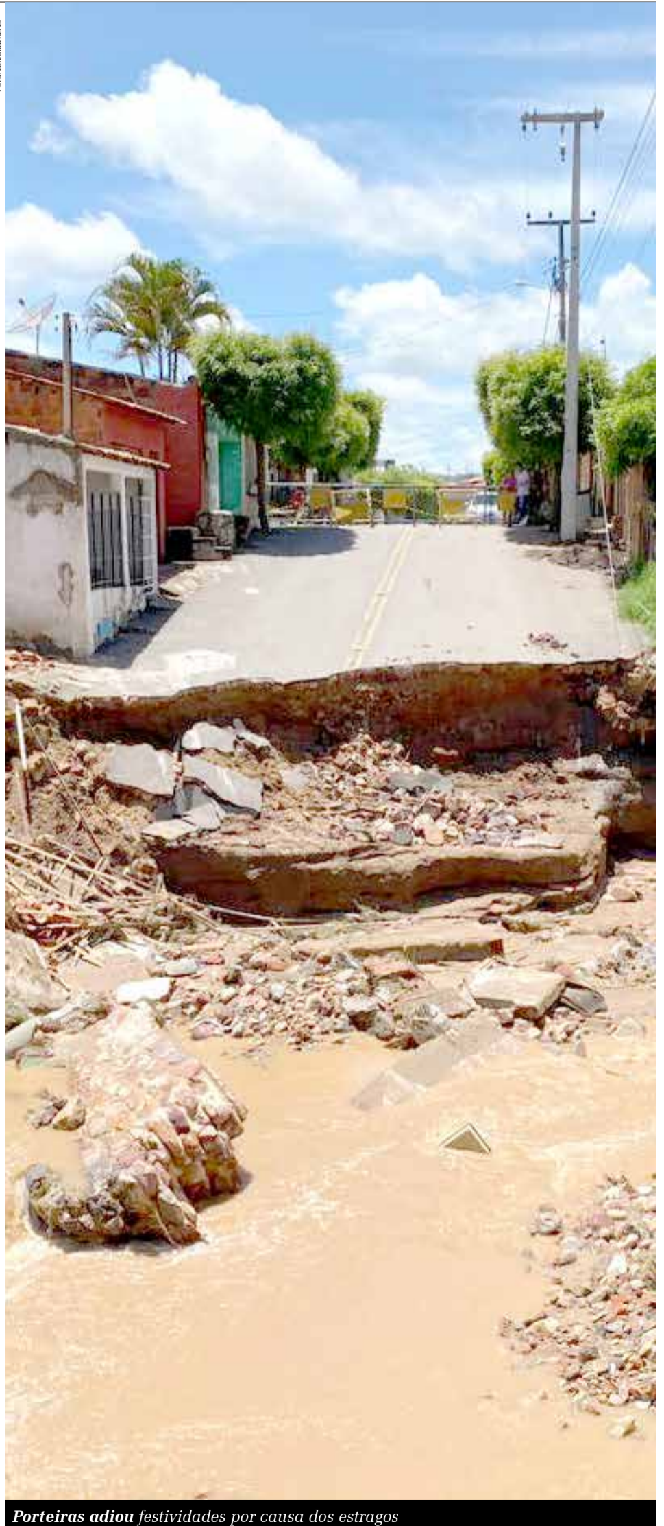
Porteiras adiou festividades por causa dos estragos