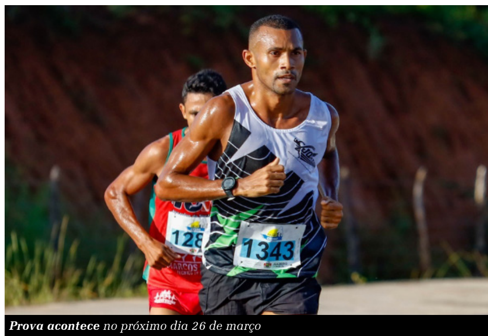
Prova acontece no próximo dia 26 de março

A Meia Maratona Padre Cícero 2023 será realizada no dia 26 de março, com 2.500 atletas inscritos, vindos de diversas regiões do país. A corrida é dividida em categorias que visam atender o considerável número de participantes, além de transformar a competição em um evento festivo e turístico desportivo.