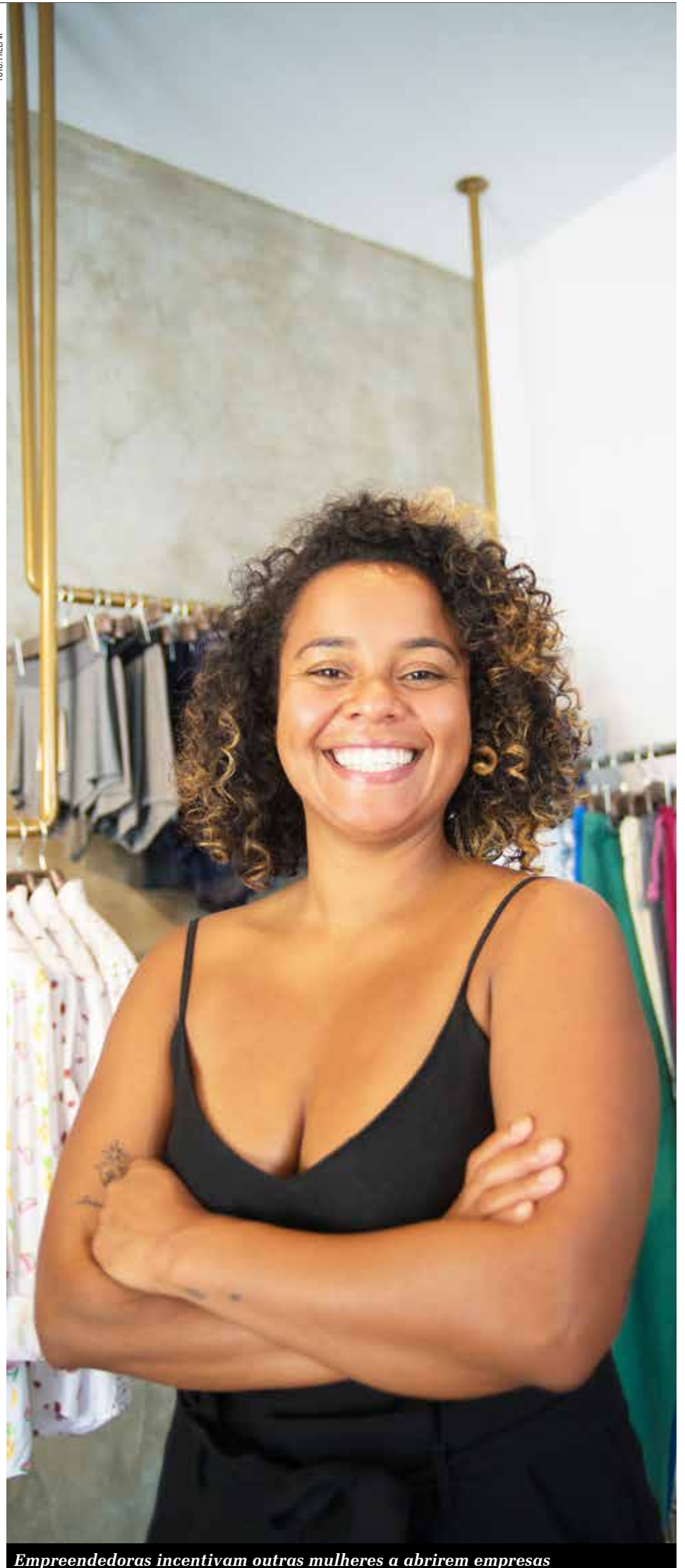
Empreendedoras incentivam outras mulheres a abrirem empresas