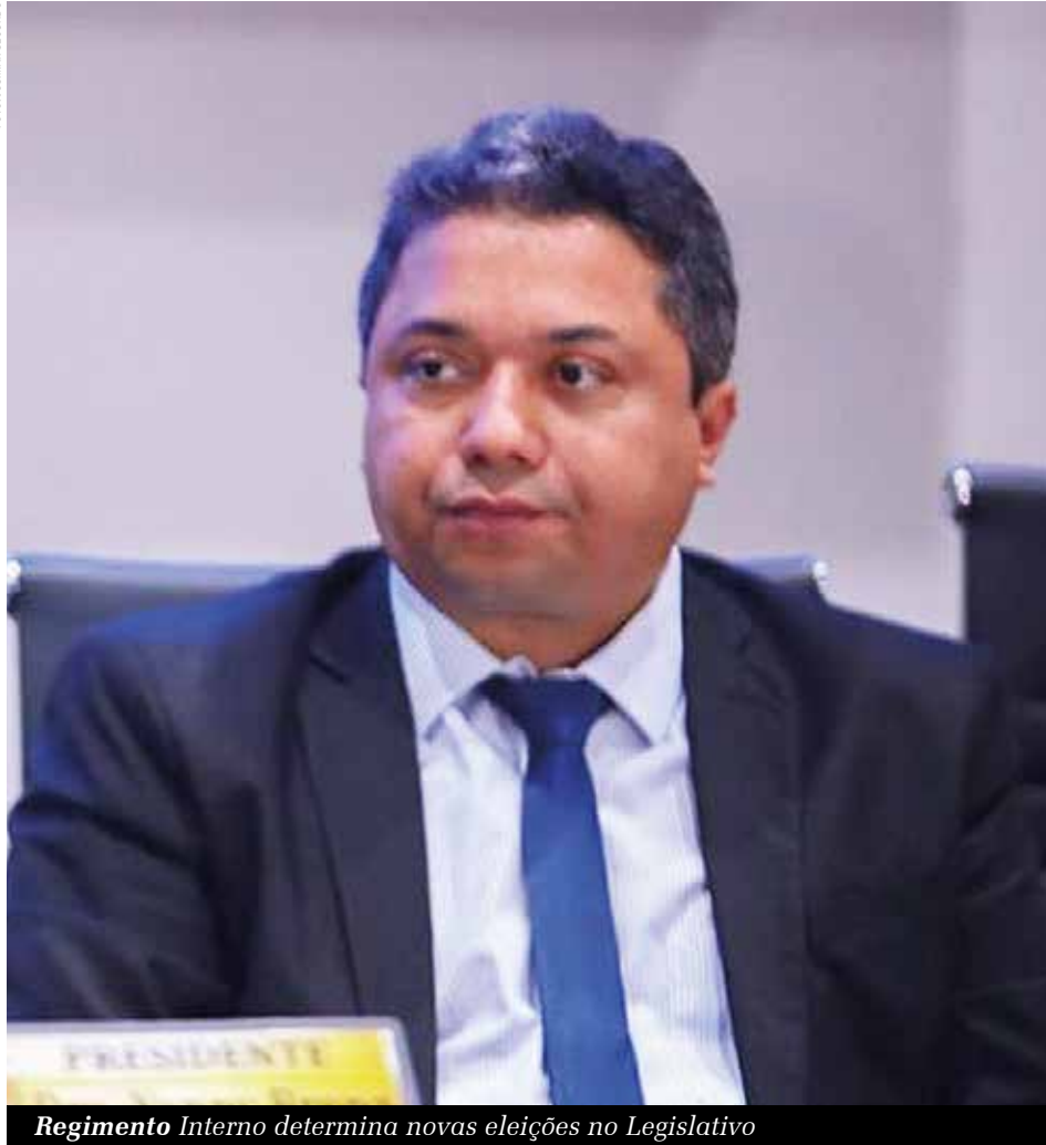
Regimento Interno determina novas eleições no Legislativo