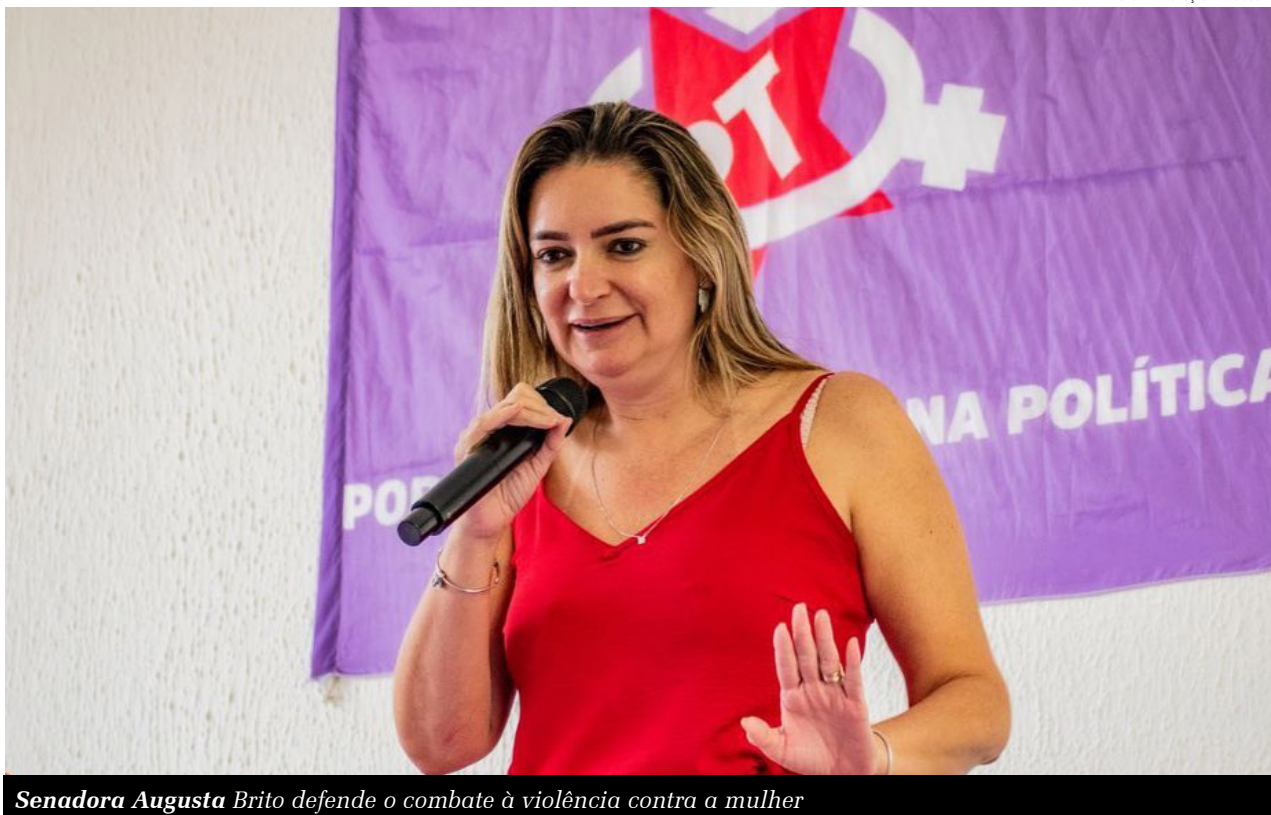
Senadora Augusta Brito defende o combate à violência contra a mulher

Joaquim Júnior redacao@jornaldocariri.com.br