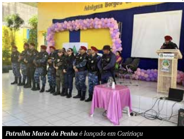
Patrulha Maria da Penha é lançada em Caririaçu

As comemorações relativas ao Dia Internacional da Mulher, no município de Caririaçu, foram marcadas por ações promovidas pela Secretaria Municipal de Assistência Social, Mulher, Trabalho e Cidadania. Um marco importante foi o lançamento da Patrulha Maria da Penha na cidade. Esse serviço garante acompanhamento preventivo periódico e maior proteção às mulheres em situação de violência doméstica e familiar, que possuem medidas protetivas de urgência vigentes, baseadas na Lei nº 11.340/2006 (Lei Maria da Penha).