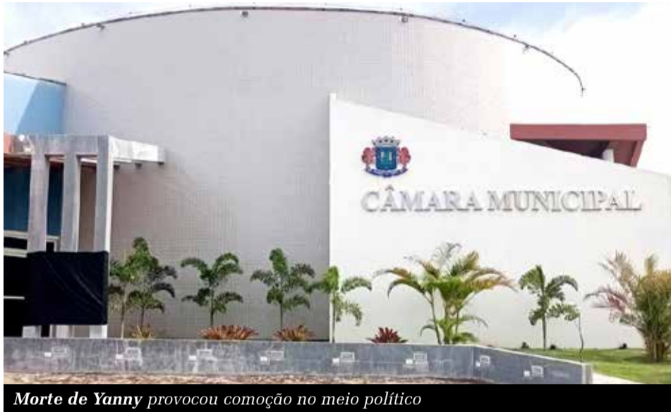
Morte de Yanny provocou comoção no meio político