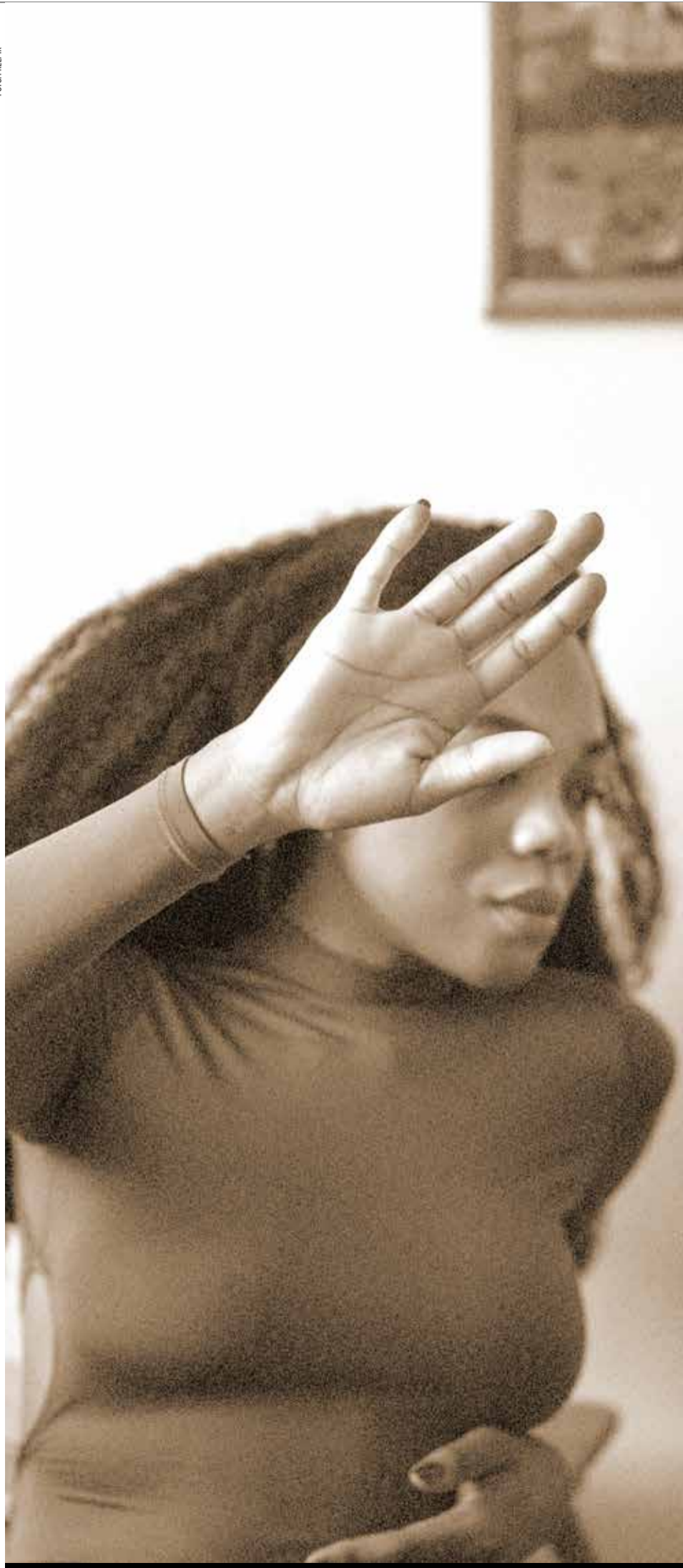
Quebra do ciclo da violência contra a mulher é defendida por ativistas

Ativista do Movimento de Mulheres na Frente de Mulheres do Cariri.