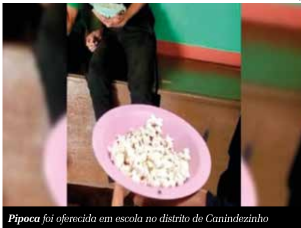
Pipoca foi oferecida em escola no distrito de Canindezinho