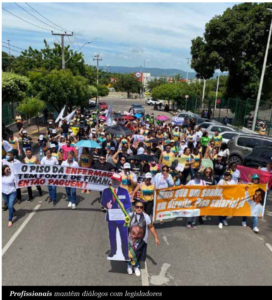
Profissionais mantêm diálogos com legisladores

A conselheira cita que já existem medidas que garantem repasses financeiros para as Santas Casas, além de outras que desoneram folhas de pagamento da iniciativa privada e aquelas que apontam as fontes de custeio para o SUS. Até o momento, não há um prazo estipulado para a resolução do problema, mas, conforme lembra, o Governo