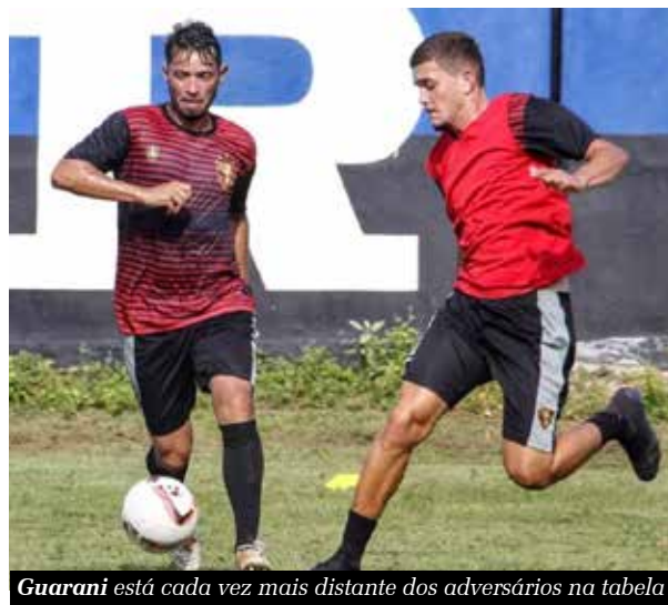
Guarani está cada vez mais distante dos adversários na tabela

A situação do Guarani de Juazeiro é cada vez mais complicada na Série A do Cearense. Com duas derrotas nas duas partidas do quadrangular do rebaixamento, o Guarani está cada vez mais distante dos adversários na tabela. Mas não é apenas pela situação na tabela. O futebol também está longe do ideal. O Guarani de Juazeiro segue a risca os passos fracassados do Crato, na temporada passada. E o final da história todos sabemos.