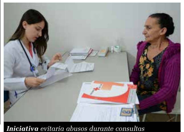
Iniciativa evitaria abusos durante consultas