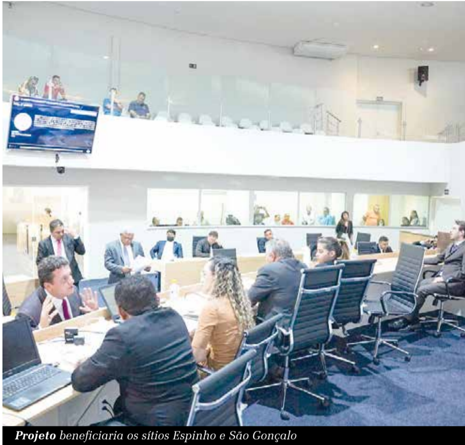
Projeto beneficiaria os sítios Espinho e São Gonçalo