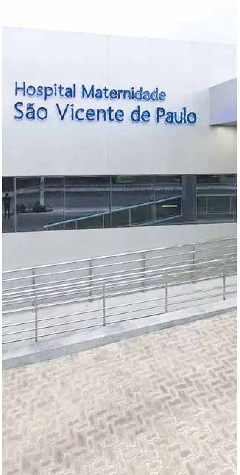
Hospital referência no tratamento do câncer está entre beneficiados