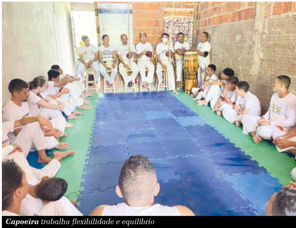
Capoeira trabalha flexibilidade e equilíbrio