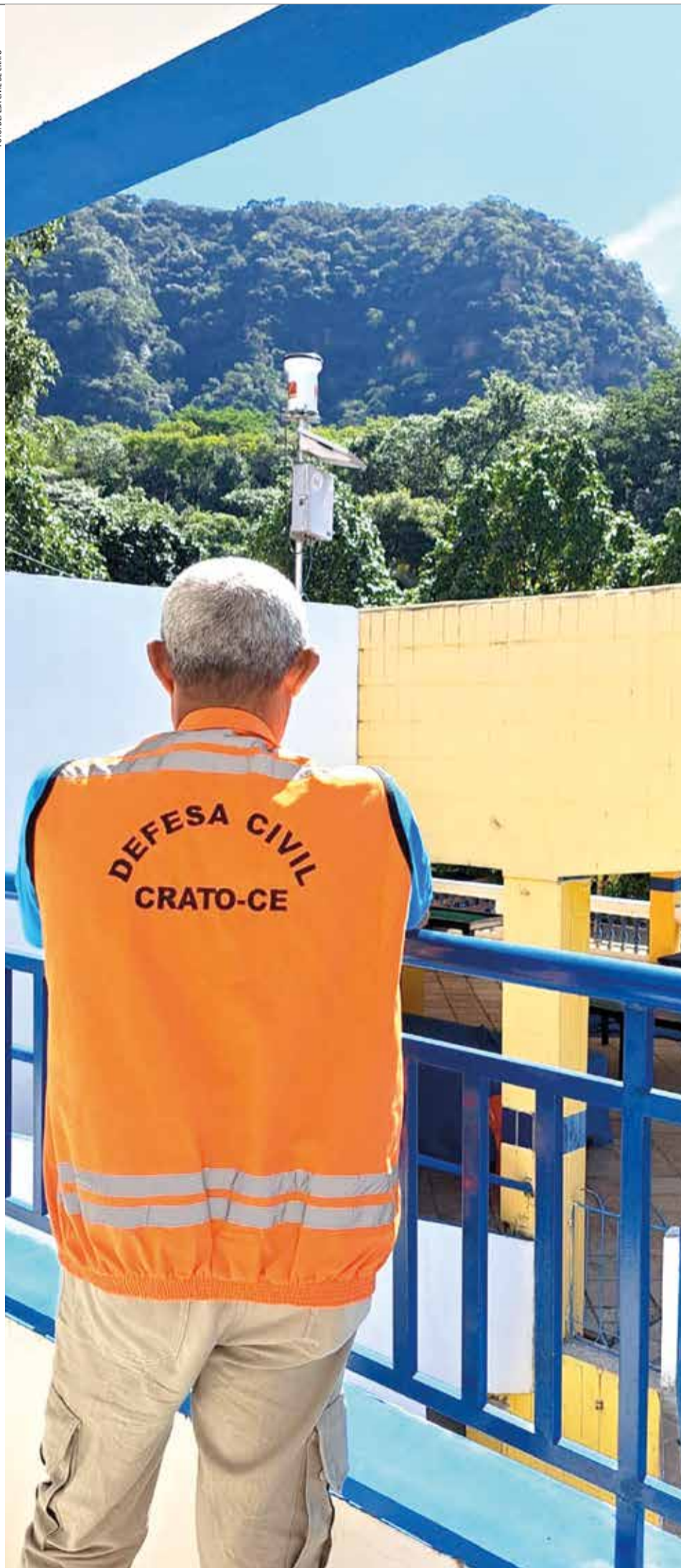
Defesa Civil mapeia áreas e monitora riscos de desastres