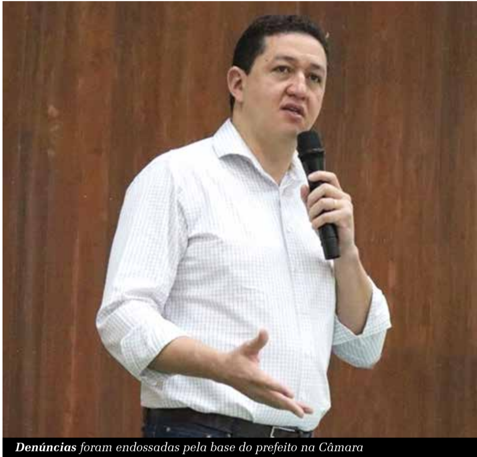
Denúncias foram endossadas pela base do prefeito na Câmara