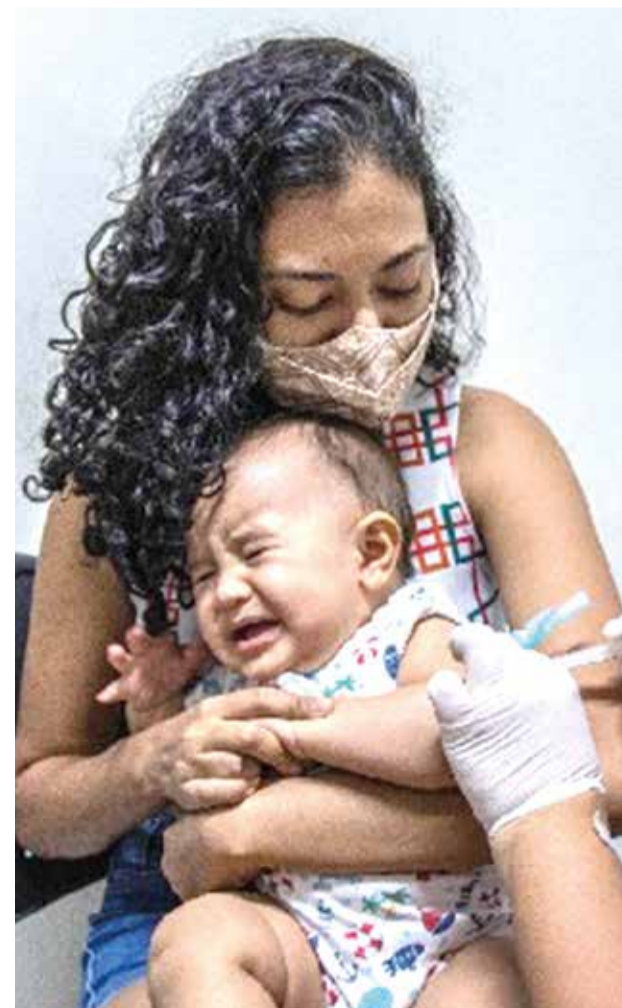
Projeto visa reduzir queda na cobertura vacinal