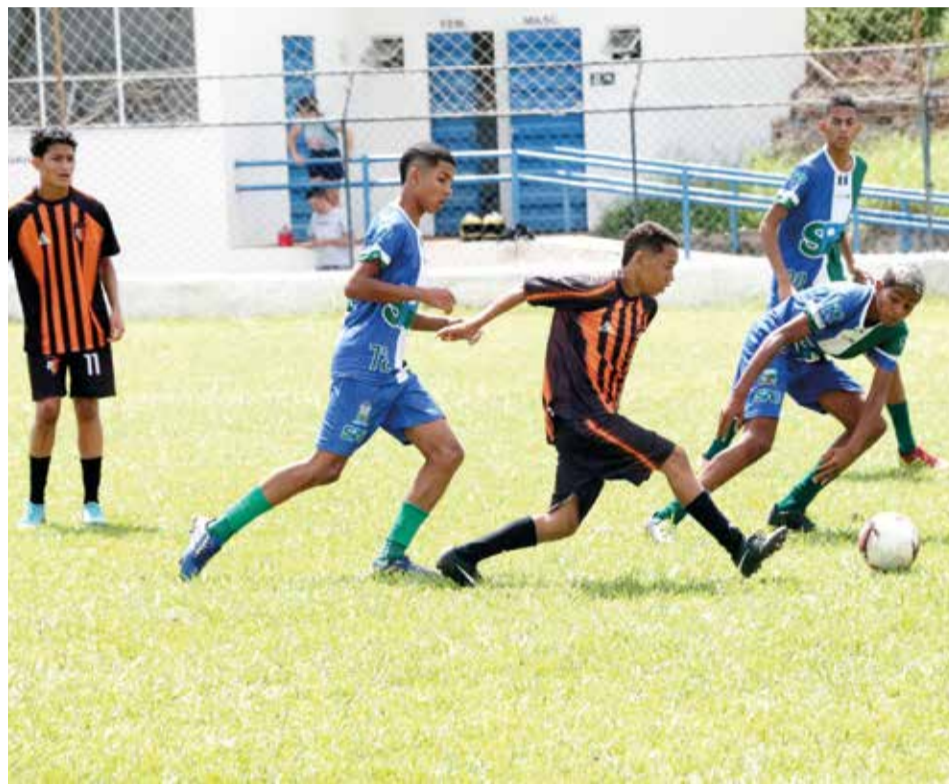
Atletas selecionados serão revelados após relatório técnico

Os aprovados passarão por um período de novas avaliações no CT Ribamar Bezerra, onde treinam as categorias de base e o time profissional do Leão do Pici. A iniciativa partiu de uma parceria entre o Barbalha Futebol Clube e a Secretaria Municipal de Juventude e Esporte.