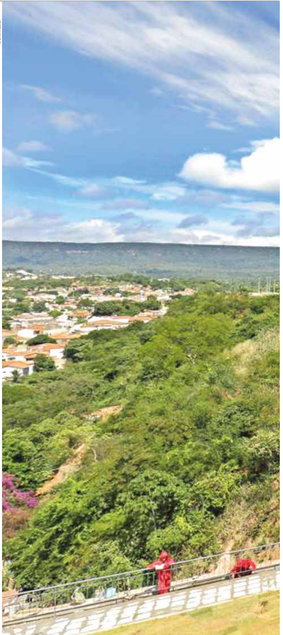
Encostas têm mais riscos de deslizamentos