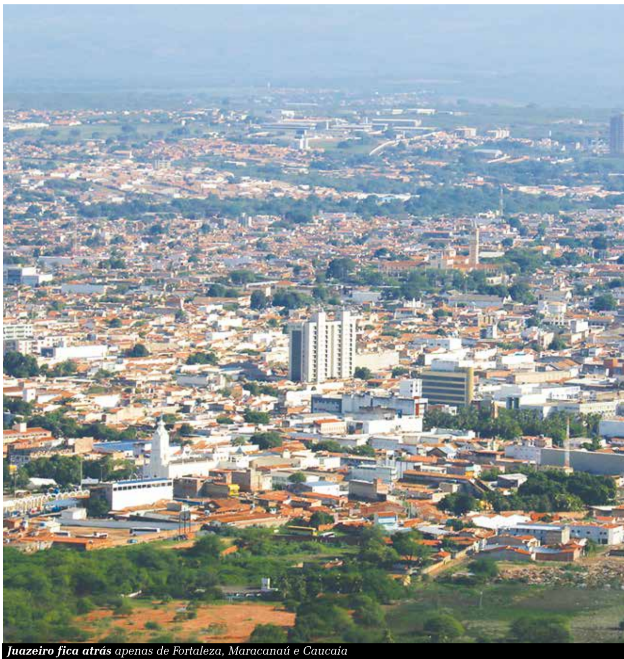
Juazeiro fica atrás apenas de Fortaleza, Maracanaú e Caucaia