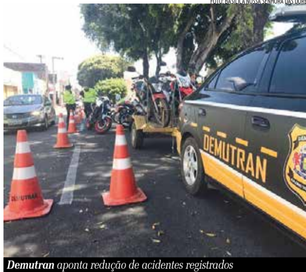
Demutran aponta redução de acidentes registrados

ídas seis rotatórias, até dezembro de 2022, com previsão de inauguração de outras duas em janeiro de 2023. Os equipamentos têm a capacidade de pro-