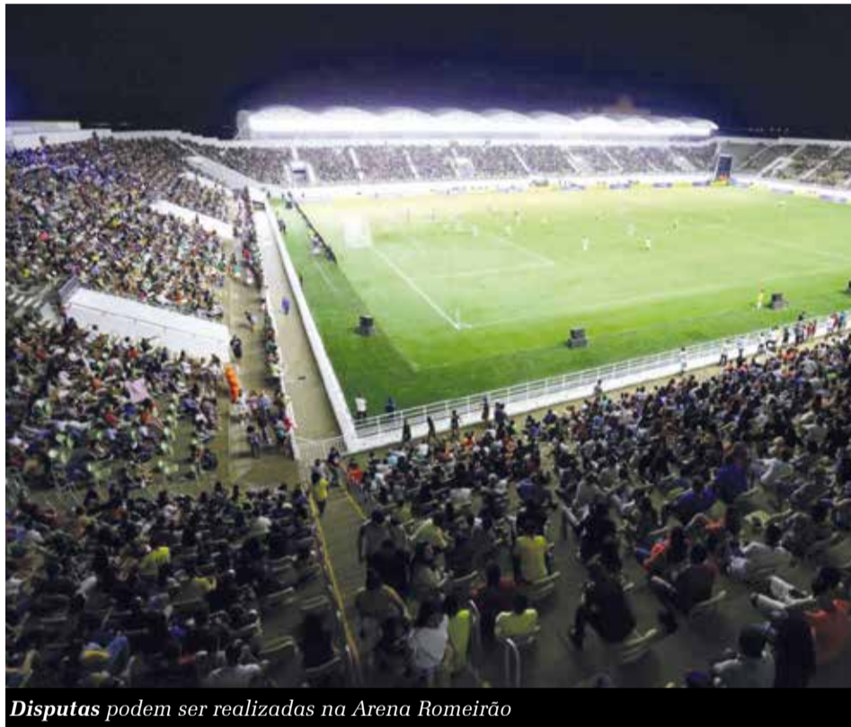
Disputas podem ser realizadas na Arena Romeirão