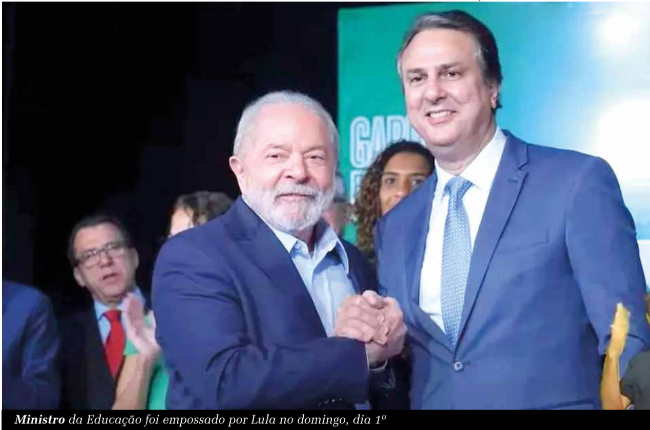
Ministro da Educação foi empossado por Lula no domingo, dia 1º