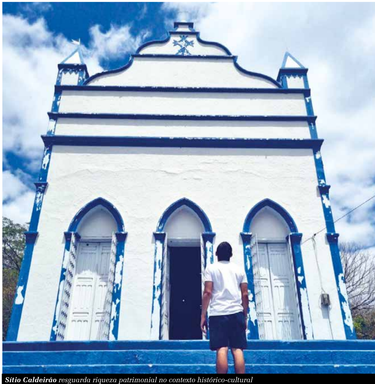
Sítio Caldeirão resguarda riqueza patrimonial no contexto histórico-cultural

los povos indígenas, com uma produção agroecológica”.