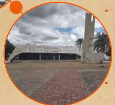
Largo do Socorro