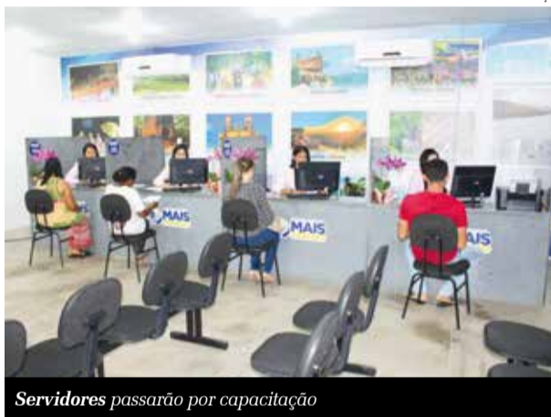
Servidores passarão por capacitação

Serviços públicos são motivo de reclamações, principalmente pela qualidade do atendimento realizado por parte dos servidores. Em Altaneira, um projeto enviado à Câmara, pelo chefe do Executivo, prevê a qualificação, atualização, modernização das habilidades sociais e tecnológicas dos servidores públicos. Com a iniciativa, a gestão municipal pretende garantir qualidade no atendimento à população. O projeto será executado pela Secretaria Municipal de Governo.