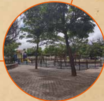
Praça das Cacimbas