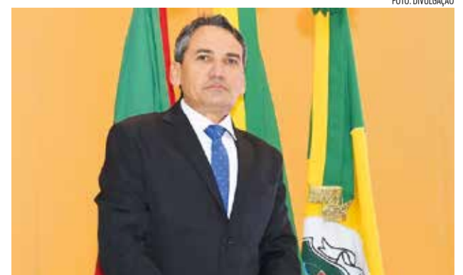
Prefeito de Granjeiro é eleito para gerir consórcio