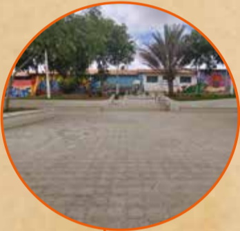
Praça Adones Callou (Praça do CC)