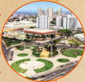
Praça do Giradouro