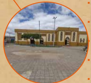
Praça do Menino Jesus de Praga